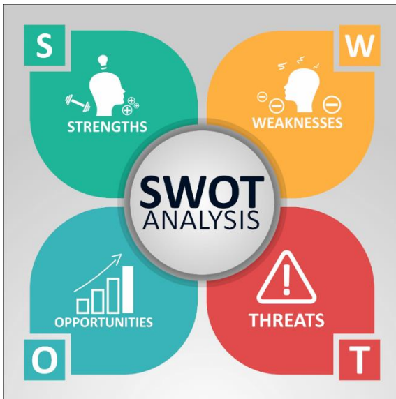
Slika 1. koncept SWOT analize

Međutim, treba uzeti u obzir kako se radi o subjektivnoj metodi.