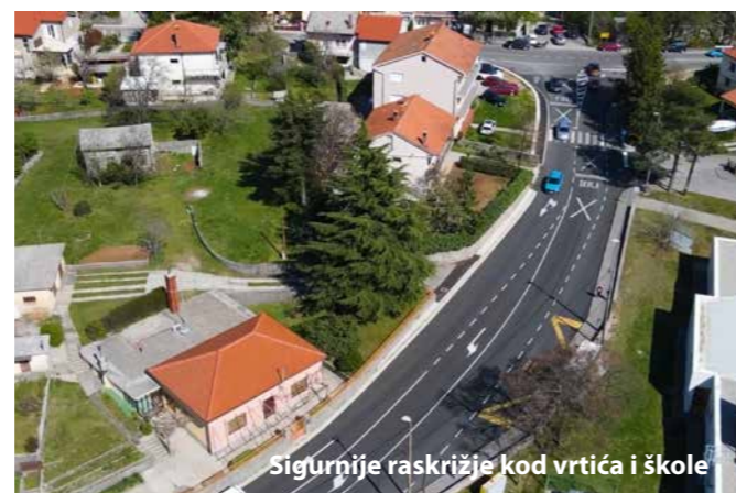
Sigurnije raskrižje kod vrtića i škole

Također, obavljani su radovi na južnoj novoj toplinskoj fasadi 6 paviljona starog dijela škole OŠ Čavle. Osim energetske uštede postignuto je i vizualno usklađenje s novim krilom. Nastavak radova očekuje se ovog ljeta. Uz to, zamijenjena su dotrajala vrata učionica u starom dijelu škole.