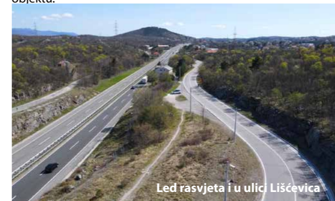
Led rasvjeta i u ulici Lišćevica

Mnogo se ulagalo se i u ostalu komunalnu infrastrukturu na području općine Čavle. Izgrađen je vodovodni i kanalizacijski priključak te asfaltiranje ulice Gorica u dužini od 300 metara. Saniran je potporni zid, izgrađen novi vodovodni ogranak i asfaltirana ulica Podopora, a sanacija potpornog zida kojem je prijetilo urušavanje obavljeno je i u ulicama Gaj i Get u Cerniku. Iza Čebuharove kuće saniran je veliki upojni bunar i izgrađen je novi upojni bazen ispred OŠ Čavle te je sve povezano u jedan sustav. Ugrađene su cijevi za odvodnju i ispred Obiteljskog poljoprivrednog gospodarstva Frankulin kako bi se umanjile količine vode koje su se slijevale prema tom gospodarskom objektu.