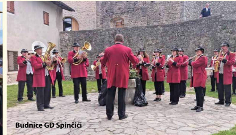
Budnice GD Spinčići