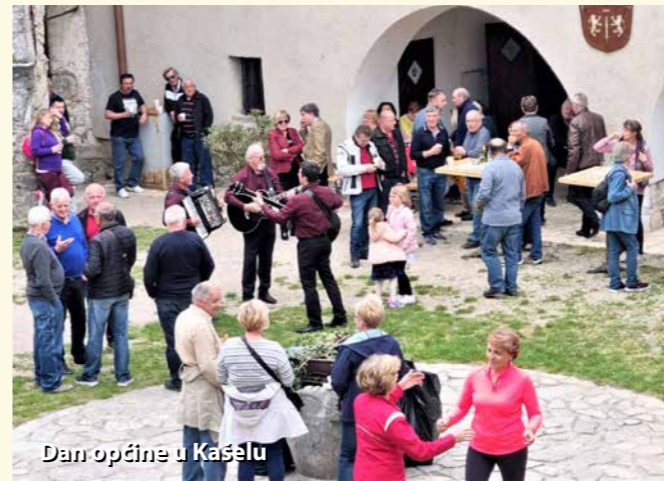
Dan općine u Kaštelu