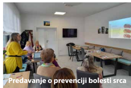
Predavanje o prevenciji bolesti srca