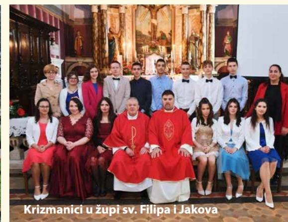
Krizmanici u župi sv. Filipa i Jakova