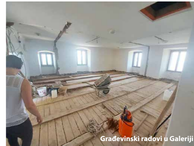
Građevinski radovi u Galeriji

Sanirali smo međukatnu konstrukciju Kaštela Grobnik. Prostor će uskoro otvoriti svoja vrata. Uredili smo prostore, uveli klimatizaciju i sanitarne čvorove.