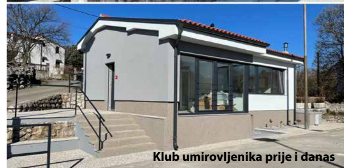
Klub umirovljenika prije i danas

Započeli smo s izgradnjom interne ceste u zoni proizvodne namjene I2 Soboli. Kapitalno ulaganje donijeti će razvoj zone, dolazak novih poduzetnika i zapošljavanje stanovništva.