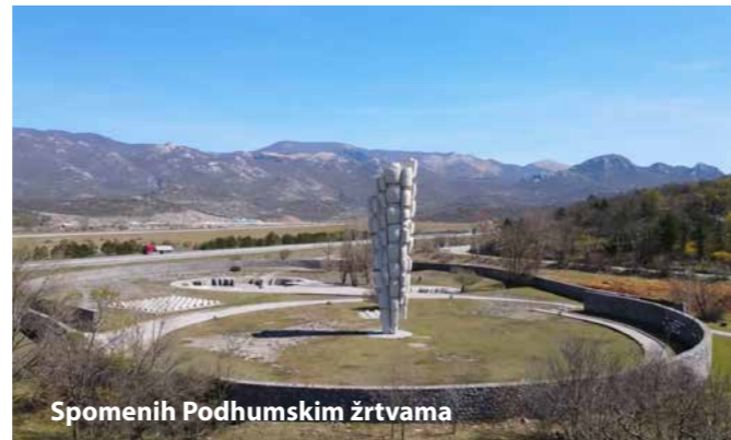
Spomenih Podhumskim žrtvama