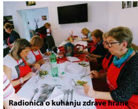
Radionica o kuhanju zdrave hrane