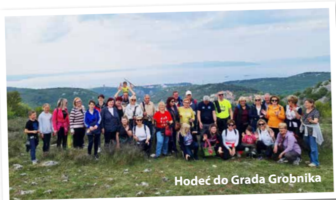
Hodeć do Grada Grobnika

stacija, po posjećenosti, bila u rangu onih događanja kojima smo svjedočili u vrijeme prije pandemije. Za vrijeme festivala craft piva, a u sklopu međunarodnog projekta „Noć tvrđava“, Interpretacijski centar Grobnik je radio organizirane interpretacijske šetnje po Kaštelu. Svi su se događaji savršeno uklopili u proslavu Filipje i Prvog maja. Od jutra su u Kaštelu pristizali posjetitelji. Druženje se odvijalo tijekom cijeloga dana uz glazbeni program i divnu atmosferu. Ovi događaji, ali i svi oni koji slijede pokazatelj su sve veće popularnosti našega Kaštela, ali i putokaz organizatorima za sve nove događaje koji nas očekuju unutar njegovih drevnih zidina.