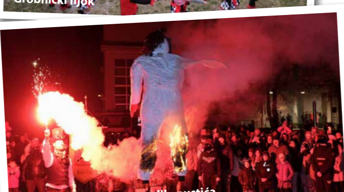
Čavjanske maškare zapalile pustića