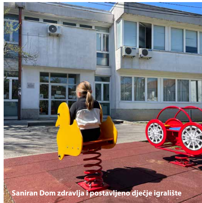
Saniran Dom zdravlja i postavljeno dječje igralište

Uveli smo plinsku infrastrukturu u Čebuharovu kuću. Prelaskom na plin i spajanjem na postojeću plinsku infrastrukturu planiramo ostvariti značajne uštede.