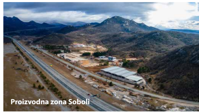
Proizvodna zona Soboli

Projekt Putovima Frankopana – udahnuo je novi život našem Kaštelu, a mi nastavljamo raditi na promicanju kulturno-turističke rute Putovima Frankopana.