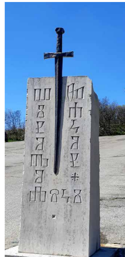
Skulptura ak. kip. Mladen Mikulin

Podsjetimo, projekt Šetnica Zakon devet gradova , prvotno je nastao pod radnim nazivom Park skulptura , a počeo je 2012. godine na poticaj Vlaste Juretić, kada su u okolici Kaštela Grobnik na trajne pozicije postavljene tri skulpture akademskih kipara Zvonimira Kamenara, Josipa Diminića i Tomislava Pavletića.