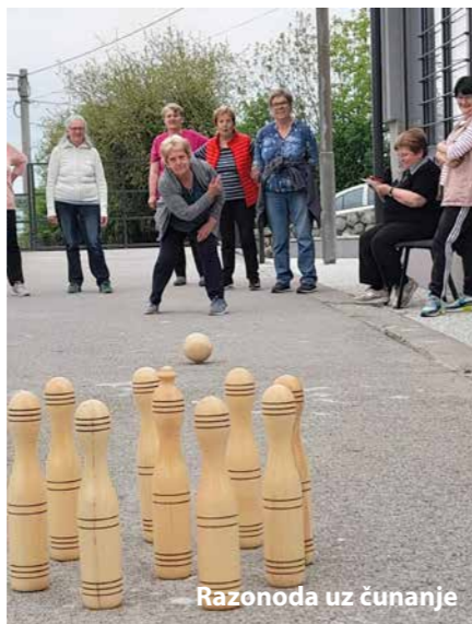
Rasonoda uz čunanje

Sve informacije o programima možete naći na Facebook stranici „Klub umirovljenika Čavle“, pozivom na broj telefona voditeljice Kluba umirovljenika Čavle Tatjane Ljuštine Milaković 099-600-2715 ili e-mailom: klub-umirovljenika@cavle.hr. Adresa Kluba umirovljenika Čavle je Griža 16, klub je otvoren ponedjeljkom, srijedom i četvrtkom od 13 do 20 sati, utorkom i petkom od 8 do 15 sati, a subotom od 8 do 13 sati.