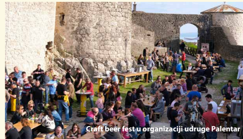
Craft beer fest u organizaciji udruge Palentar