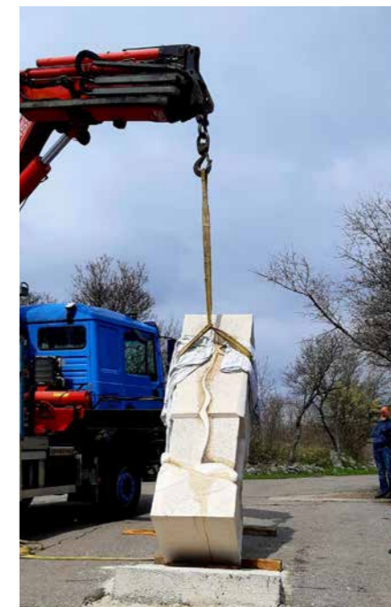
Postavljanje skulpture ak. kip. Zvonimira Kamenara

Šetnica Zakon devet gradova jedinstven je projekt u spomen na jedan od najznačajnijih i najstarijih srednjovjekovnih europskih pravih spomenika – stvarnog Zakona devet gradova, poznatog kao Vinodolski zakon iz 1288. g. Zakon je pisan na glagoljici i narodnom jeziku – čakavskom. Budući da je u stvaranju ovog, za cijelu Europu izuzetno važnog srednjovjekovnog Zakona, kao jedni od predstavnika 9 srednjovjekovnih frankopanskih vinodolskih općina sudjelovali i naši preci, Grobničani, njegovi su korijeni između ostalog i grobnički. I upravo na temeljima Vinodolskog zakona započelo je stvaranje ovog jedinstvenog hrvatskog spomenika europskoj, pa i svjetskoj baštini.