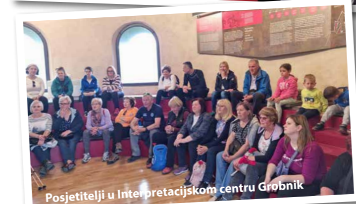
Posjetitelji u Interpretacijskom centru Grobnik