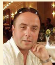
Autor: Cvetan Pečić

Da su šli dva Grobničana va kino i gjedaju film i va jednoj sceni filma počne padat daž ko z kabl. A veli prvi drugomu : - No, sad smo odbavni... daž pada, a mi lumbrele nimamo!