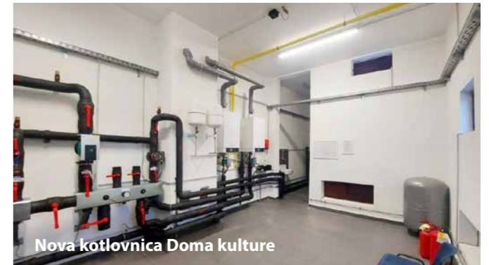
Nova kotlovnica Doma kulture

Modernizirali smo kotlovnicu Doma kulture Čavle. Sa lož ulja prešli smo na plin. Dom kulture je sada spojen na plinsku mrežu.