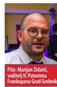
Piše: Marijan Zidarić, voditelj IC Putovima Frankopana Grad Grobnik