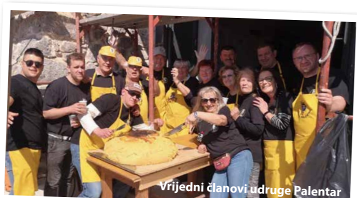
Vrijedni članovi udruge Palentar