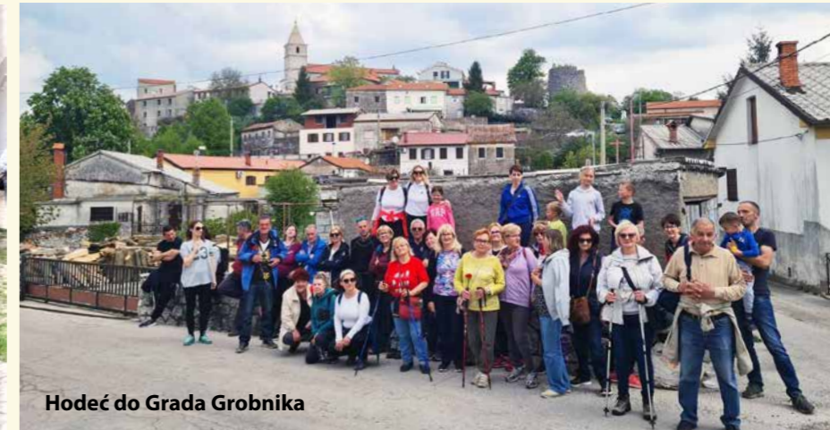
Hodeć do Grada Grobnika