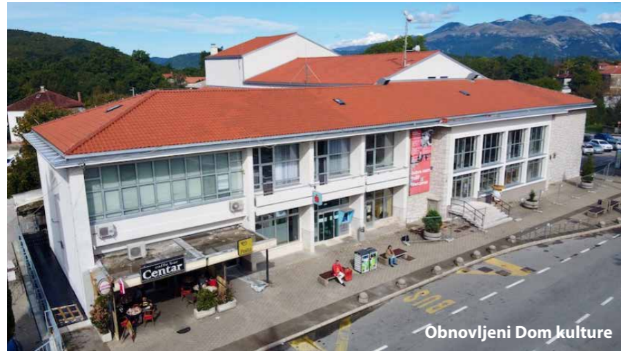
Obnovljeni Dom kulture