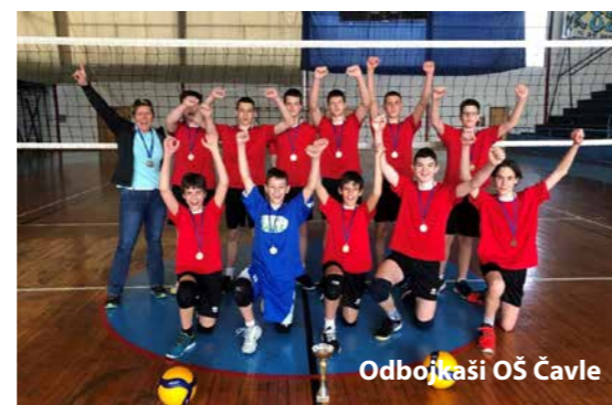
Odbojkaši OŠ Čavle

Piše: Tanja Stanković, ravnateljica OŠ Čavle