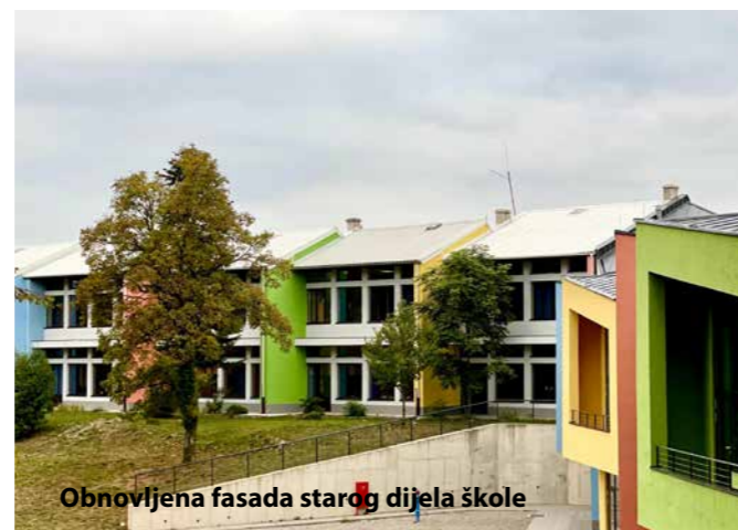
Obnovljena fasada starog dijela škole

Također, obavljani su radovi na južnoj novoj toplinskoj fasadi 6 paviljona starog dijela škole OŠ Čavle. Osim energetske uštede postignuto je i vizualno usklađenje s novim krilom. Nastavak radova očekuje se ovog ljeta. Uz to, zamijenjena su dotrajala vrata učionica u starom dijelu škole.