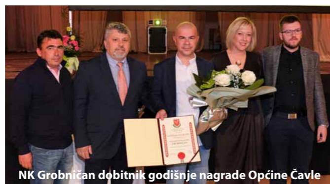
NK Grobničan dobitnik godišnje nagrade Općine Čavle