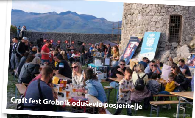
Craft fest Grobnik oduševio posjetitelje