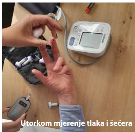
Utorkom mjerenje tlaka i šećera