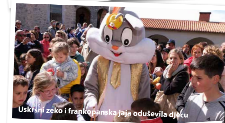
Uskršni zeko i frankopanska jaja oduševila djecu