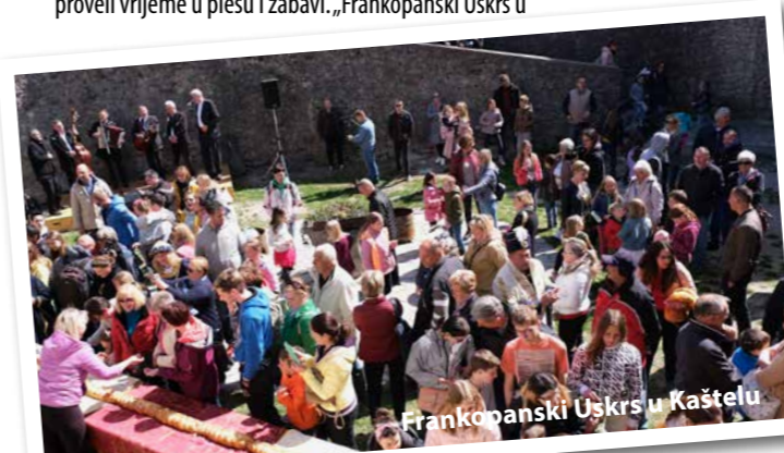
Frankopanski Uskrs u Kaštelu