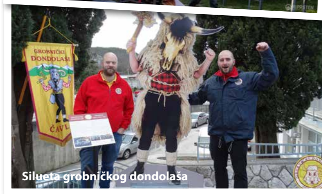
Siluetu grobničkog dondolaša