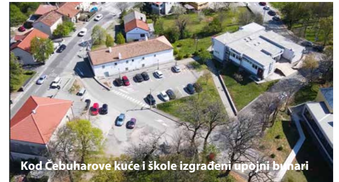
Kod Čebuharove kuće i škole izgrađeni upojni bunari

Asfaltirana je cesta i raskrižje na županijskoj cesti Čavle-Dražice. Naime, izvedeni su radovi na sanaciji kolnika na raskrižju u centru Čavala kod Filona te izgradnji nogostupa. Dobiven je tako sigurniji prijelaz za pješake i ljude koji koriste javni prijevoz s obzirom da se tamo nalazi autobusna stanica koju najviše koriste djeca.