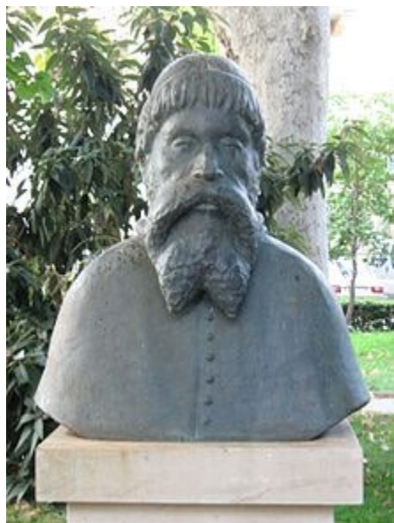
Slika 6. Kip Bernardina Frankopana.