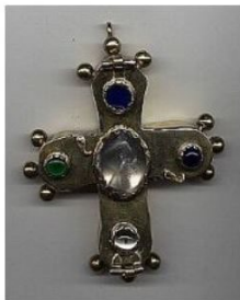
Slika 8. Križevi iz postava etnografske zbirke. Na ekranu prikazati slike zvona i 3 križa.

U Hrvatskome povijesnome muzeju u Zagrebu, u sklopu Zbirke Najstariji hrvatski križevi čuvaju se i tri križa iz župne crkve sv. Filipa i Jakova na Grobniku. Kako bi se obogatio postav Zavičajnog muzeja Grobinščine za dva od tri križa su izrađeni odljevi u suradnji s Gliptotekom u Zagrebu.