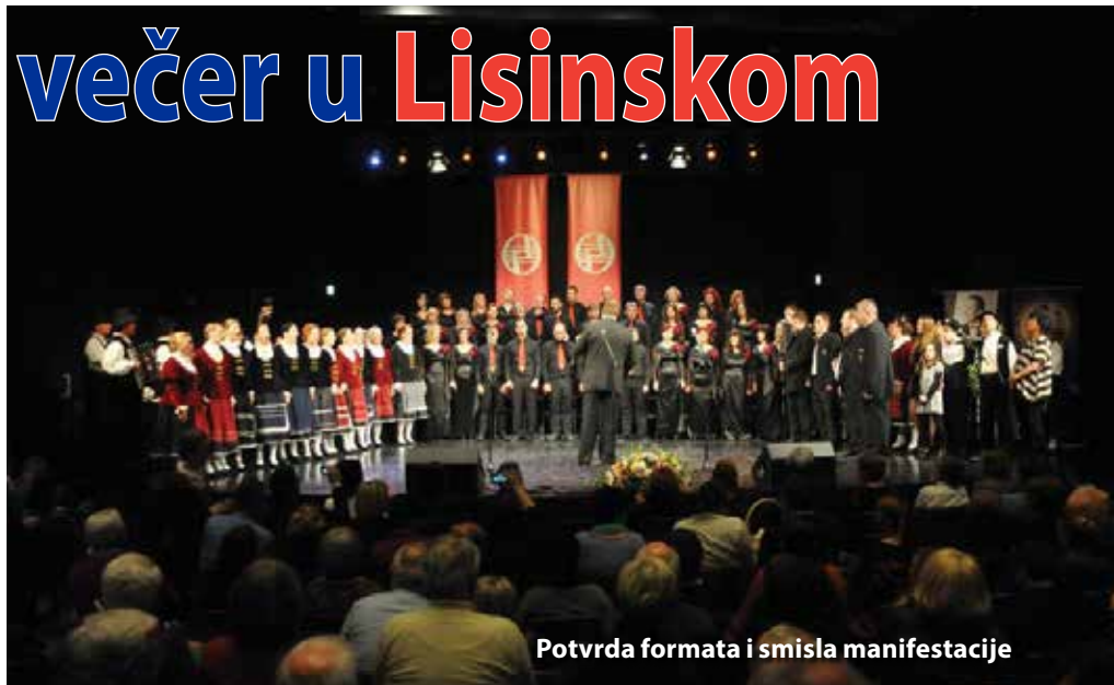
Potvrda formata i smisla manifestacije

Zagrebačku Grobničku večer posebno su obilježile dvije iznimne Grobnišćice, pjesnikinja Vlasta Juretić i hrvatska predsjednica Kolinda Grabar Kitarović. Prema riječima Vlaste, predsjednica je u po-