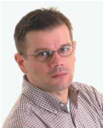
Piše: Dražen Herljević