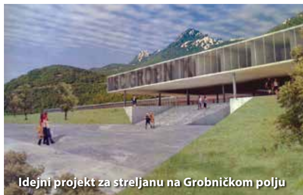
Idejni projekt za streljanu na Grobničkom polju

ženo milijun kuna, a da bi projekt išao naprijed potrebno je riješiti pitanje zemljišta koje se sada nalazi u vlasništvu države te prilagoditi Prostorni plan.