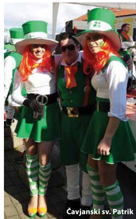
Čavjanski sv. Patrik

Buzeta i Grižana. Istog dana, a sve u sklopu Grobničkog maskaranog vikenda održao se i prvi maskarani rally u organizaciji Čavjanskih maškara, a maskirani vozači okušali su se i u ispitu spretnosti.