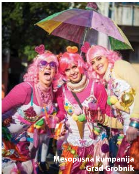
Mesopusna kumpanija Grad Grobnik

Grobnički dondolaši, Čavjanske maškare i Mesopusna kumpanija glavni akteri maskaranih događanja na području općine Čavle, ali i šire