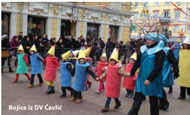
Bojice iz DV Čavlic

u Bočarskom domu Hrastena kojeg su organizirali Bočarski klubovi Sloga i Frankopan. A tjedan dana kasnije maškare su se skijale i sanjkale i to tehnikom "kako ki more i umi". Naime, održan je 15. M a š k a r a n i