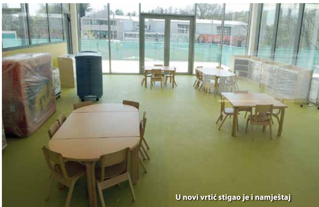
U novi vrtić stigao je i namještaj

U vrijeme pisanja ovoga teksta izgradnja, opremanje i uređenje novoga prostora Dječjeg vrtića je dovršeno, u tijeku je redovan postupak za dobivanje uporabne dozvole, a svečano otvorenje, kako nam je rekao načelnik Općine Čavle Željko Lambaša, se očekuje tijekom mjeseca svibnja ove godine.