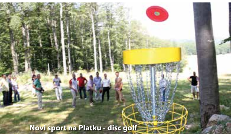
Novi sport na Platu - disc golf