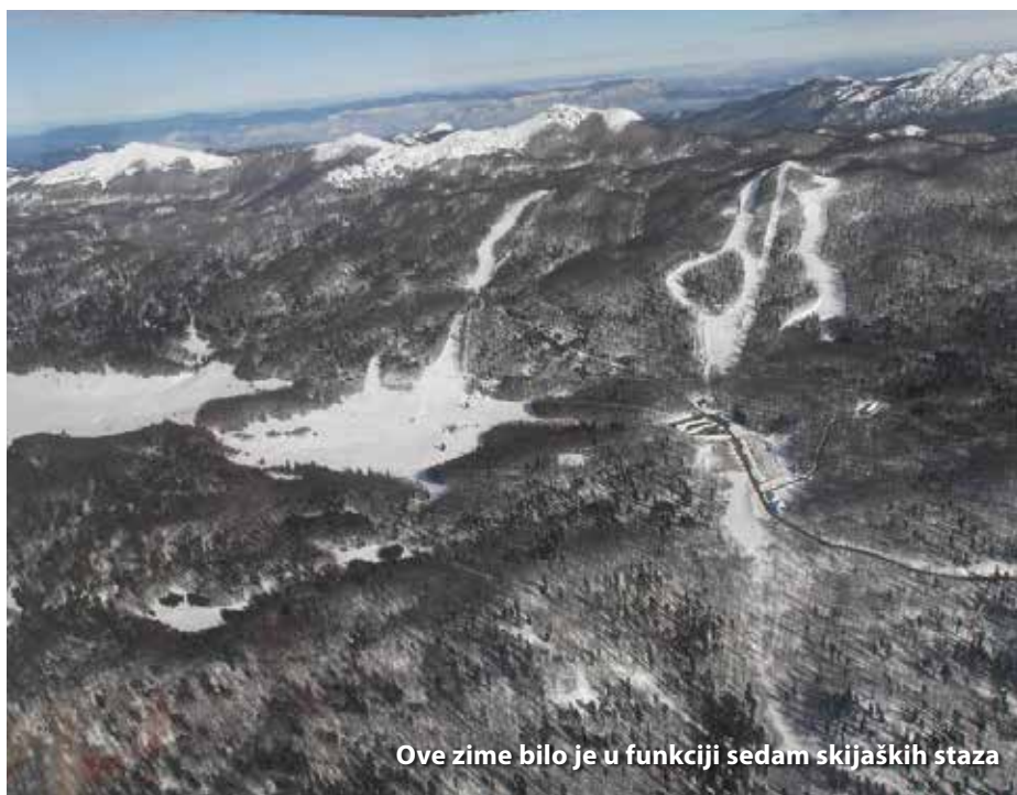
Ove zime bilo je u funkciji sedam skijaških staza

Ove će godine Županija u Platak uložiti još 6,5 milijuna kuna. Nastavlja se izgradnja četvrte faze parkirališta, te uređenje cjelogodišnjih sadržaja, kao što su poučne staze, sportski tereni za male sportove (mali nogomet, rukomet, odbojka, badminton i košarka), dječja igrališta,