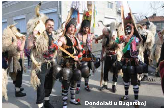
Dondolaši u Bugarskoj

Tradicionalno prve subote, već od jutro dondolaši su obahajali općinu Čavle, a dan kasnije i Jelenje. Tijekom mesopusta Grobnički dondolaši predstavili su se u Pašcu, na Halubajskom karnevalu, Smotri mičić zvončari u Marčeljima, na Kukuljanovu, u