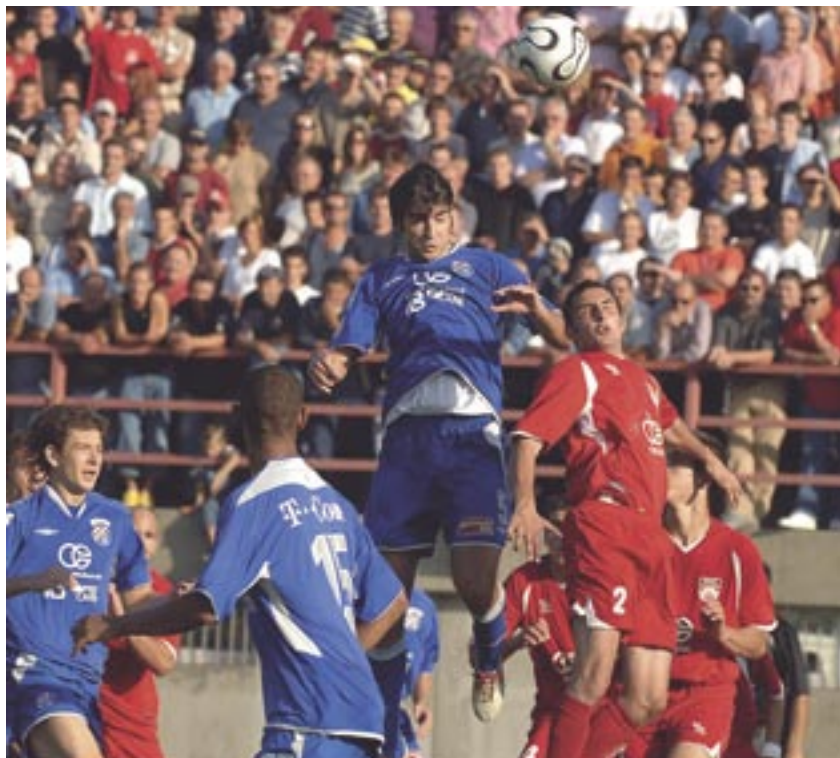
Detalj s povijesne utakmice s državnim prvakom Dinamom u Mavrincima

Nogometni klub Grobničan osnovan je 1932. godine i najstariji je sportski kolektiv na području Općine Čavle koji ove godine slavi 75 godina postojanja. Upravo uoči ove obljetnice, tijekom 2006. godine klub je postigao zapažene rezultate i to kako seniorske ekipe tako i mladih dobnih kategorija. Najzapaženiji je uspjeh osvajanje Županijskog kupa te plasman u završnicu kupa Hrvatske što je rezultiralo utakmicom u Mavrincima između Grobničana i Dinama. Toj utakmici koja je završila rezultatom 0:2 prisustvovalo je tri tisuće gledatelja. Klub danas ima 126 registriranih igrača, dok je u školi nogometa 44 dječaka, što čini broj od ukupno 160 aktivnih igrača.