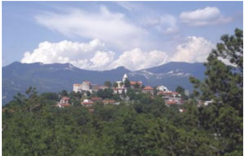
Grad Grobnik: Do 1895. godine sjedište jedinstvene Grobničke općine

Rasprava na ovu temu trajala je najduže. U njoj su svi govornici željeli izraziti punu podršku suradnji i dati poneku vlastitu ideju. Izdvajamo njihovo ukazivanje na izradu zajedničkog suvenira i zajedničkog prospekta,