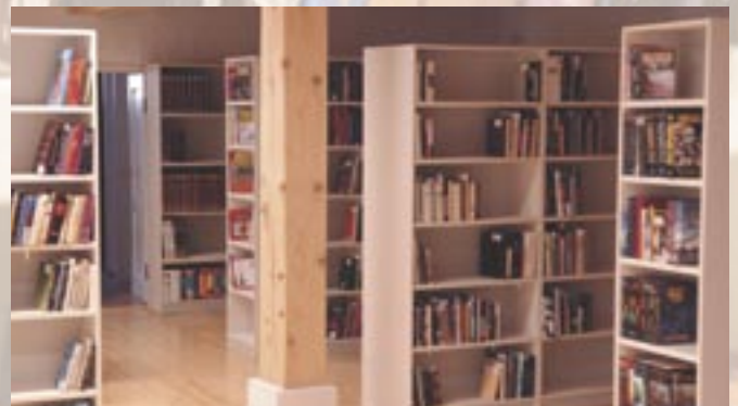
Kapacitet knjižnice je 15 tisuća knjiga, a za početak je pribavljeno oko četiri tisuće

Pravo korištenja: Usluge knjižnice mogu koristiti samo njeni članovi. Članom se postaje upisom i uplatom godišnje članarine. Iznos članarine: 30 kn. Posudba: Jedna do tri knjige na 30 kalendarskih dana, Zakasnina: 0,50 kn po danu i po knizi.