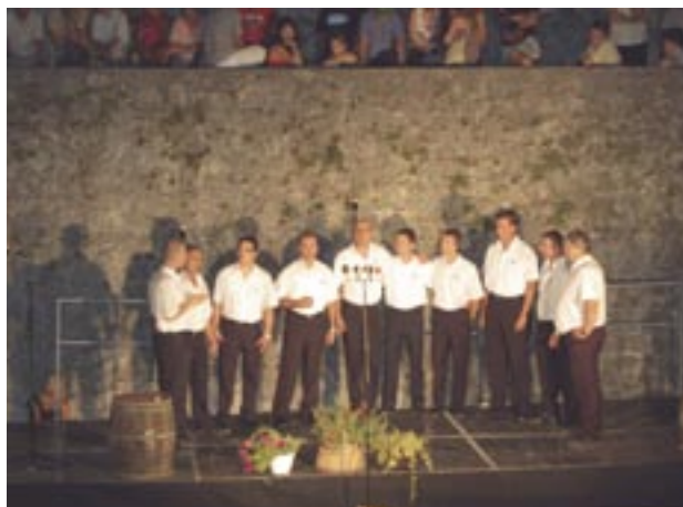
Klapa Grobnik ovo leto va Kaštelu

I sad već triba pomalo mislet o drugon kulturnon letu va kaštelu, složiti programi, dogovoriti, pa videt ča to košta i poč va realizaciju drugo leto, još bolje i još veće. Dokli bude ovako se većega interesa judih za leto va kaštelu, mi ćemo se potruditi da z leta valetu paričamo se boji i se više programih.