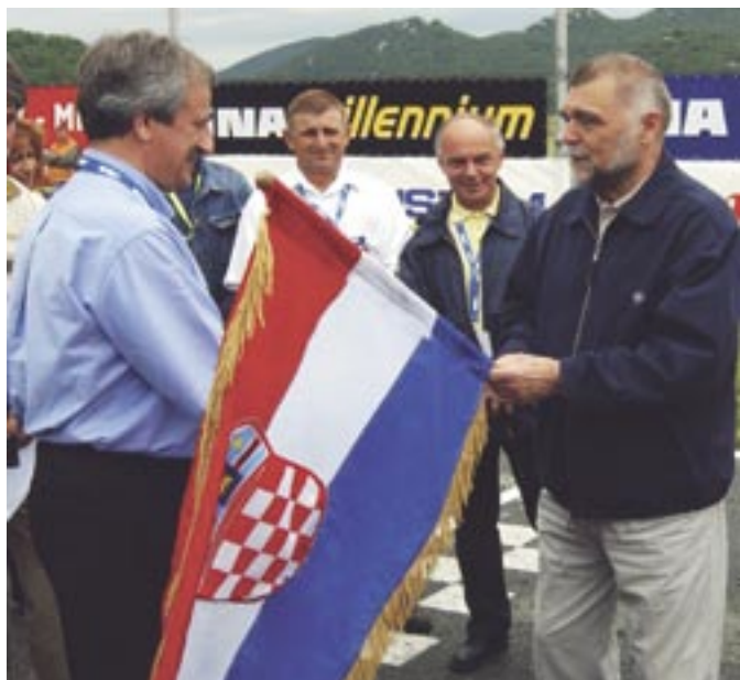
Igor Eškinja i hrvatski predsjednik Stjepan Mesić na Automotodromu "Grobnik"

Sportske utrke na Grobničkom polju tijekom cijele godine privlači tisuće i tisuće natjecatelja, sportskih djelatnika i gledatelja iz Hrvatske i svijeta. Svi oni ujedno su i gosti Općine Čavle i ovoga kraja, pa prema tome i korisnici smještaja, prehrane i ostalih turističkih usluga