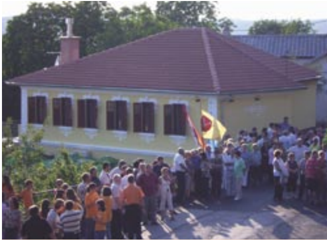
Općina Čavle je u uređenje čitaonice uložila 953 tisuće kuna

Povodom Dana pobjede i domovinske zahvalnosti u subotu 4. kolovoza svečano je otvorena obnovljena zgrada čitaonice u Gradu Grobniku. Investicija je stajala 953 tisuće kuna, a novac je osiguran iz Proračuna Općine Čavle. Rekonstruirana je zgrada u cijelosti, prizemlje i kat, podovi, stolarija, fasada i krovište. Promijenjene su i sve instalacije, a nabavljen je i novi namještaj. Objekt će koristiti članovi nedavno obnovljenog Kulturno-umjetničkog društva Ante Kamenar, zatim Udruga mladih te mještani Grada Grobnika i to bez novčane naknade. Naime, vlasnik čitaonice bio je KUD Ante Kamenar koji nije imao sredstava za njezinu obnovu, pa je zgradu preuzela Općina Čavle i obnovila, a sada ju je dala na korištenje spomenutim Udrugama.