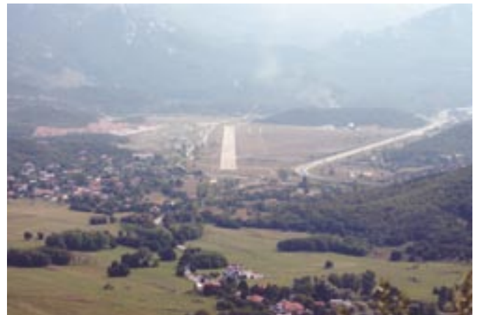
Stvaraju se prostorno - planske pretpostavke za proširenje Sportskog centra Grobnik

Što se aerodroma tiče planira se izgradnja novog hangara uz organizaciju zrakoplovno-tehničkog servisa