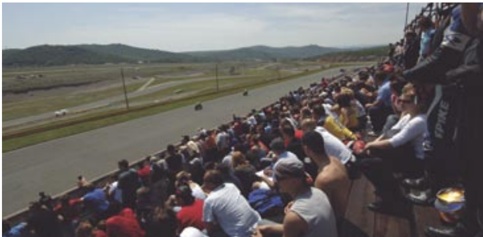
Uskoro, nadamo se, na Grobničkom polju i preko 100 tisuća gledatelja

prije svega zbog tržišnih, prostornih i financijskih ograničenja. Stoga smo umjesto vozača Formule 1 usmjereni stvaranju uvjeta za dolazak najboljih svjetskih motociklista u superbikeu ili brzinskom motociklizmu, odnosno mogućnosti organizacije utrke svjetskog prvenstva koja može okupiti i preko sto tisuća gledatelja. A za to su potrebni i veliki naponi i velika financijska sredstva.