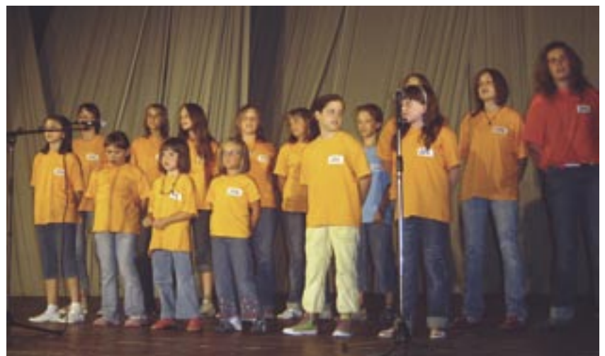
Zbor djece i mladih KUD-a «Ante Kamenar» trenutno okuplja 21 pjevača od 3 do 18 godina.

U obnovljenoj zgradi Narodne čitaonice Grobnik, koju je Općina Čavle dala na upravljanje našem KUD-u, dobili smo optimalne uvjete za djelovanje Zbora djece i mladih. Stoga smo postavili i ambiciozne planove, a to su: sudjelovanje na dječjim festivalima, dobrotvorni koncerti za djecu s posebnim potrebama, te praćenje svih kulturnih događaja u našoj Općini i regiji.