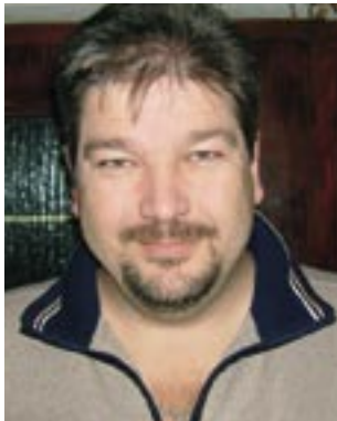
Piše: Robert ZAHARIJA

Ovo leto je evo pasalo, a zad nas su tepla sjećanja na leto va Kaštelu. Skoro saki ki je bil gori na bilo koj predstavi, došal je i na drugu i treću...i sobun dopejal još koga tako da je z predstave va predstavu bilo se više judih va Kaštelu. Bilo je lipih programa sake sorte, za sačiju dušu.