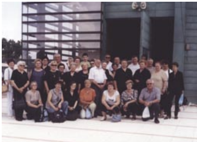
Članovi Udruge roditelja poginulih branitelja iz Domovinskog rata ispred obnovljene crkve Majke Božje Aljmaške