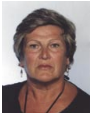
Piše: Biserka Fućak

Dopejali smo se kasno zapolne va Vukovar. Dosta se gradi, obnavlja ali puno toga zjapi; zidine zgarišta, okol njih trava. Z nečijih domih rastu visoka stabla. Pitan se: