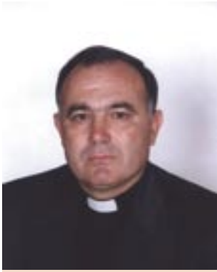
Piše: vlč. Pero Zeba