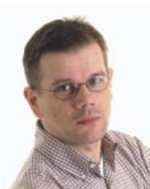
Piše: Dražen Herljević

Stare Bartoje se i ja pomalo sjećan. Va Cerniku kraj crikve vavik je bil samanj komu smo se mi dica najviše veselili, pa čak i mi z Sobolih ki smo imeli fanj za klipsat. Ženske su, pak, obavezno šle k maši, a muški, razumi se, na utakmicu va Mavrinci, a potli, a kamo drugamo nego va oštariju