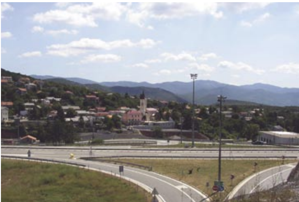
Crkva sv. Bartola u Cerniku s novim pratećim sadržajima u novom ambijentu

U prigodi ovogodišnje proslave sv. Bartola, zaštitnika naše župe, želim svratiti tvoj pogled, draga kršćanska majko i odgojiteljice, prema takvim uzorima. A tebe oče, poglavaru obitelji, potičem da se ispuniš duhom sv. Bartola, te svoje potomstvo privedeš njegovim izvorima.