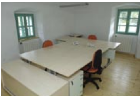
Unutrašnjost obnovljene Čebuharove kuće

U svibnju općinska uprava Čavala preselit će iz zgrade Doma kulture u Čebuharovu kuću. Općina Čavle sanaciju Čebuharove kuće počela je 2002. godine. Tijekom obnove konzultirani su konzervatori budući da je ta zgrada