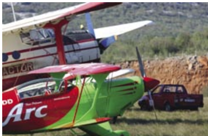
Aerodrom Grobnik domaćin 7. Aeromitinga

Sedmi tradicionalni Aeromiting na Grobniku održati će se u nedjelju 6. svibnja u organizaciji Zrakoplovnog društva Krila Kvarnera i Zajednice tehničke kulture. Gledateljima će se predstaviti Akro grupa Krila Oluje Hrvatskog ratnog zrakoplovstva s vrhunskim akrobats-