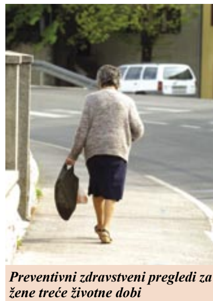
Preventivni zdravstveni pregledi za žene treće životne dobi