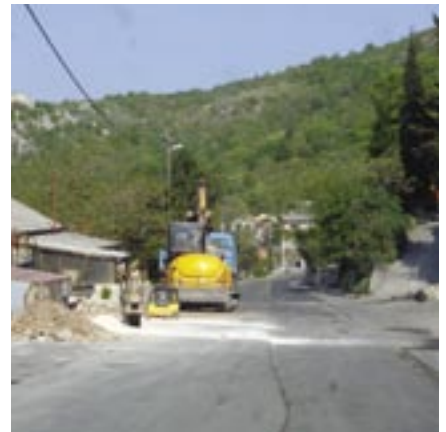
Gužvama je zasad kraj - postavljeno više od 6 kilometara kanalizacijskog kolektora

Izgradnja kanalizacijskih kolektora i to prve faze po projektu Sustav odvodnje otpadnih voda Rijeka – Grobnik postepeno se privodi