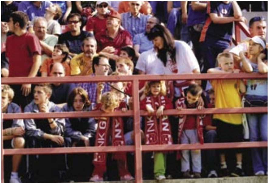
Do istrčavanja igrača na teren svatko se zabavlja na svoj način. Ovog budućeg igrača uz ogradu sada najbolje zabavlja - duda varalica

Svaka nogometna sezona, kao i svaka utakmica, ima svoj sportski adrenalin, svoju priču i svoje junake. Sportska povijest, međutim, izdvaja najzbudljivije utakmice, najviše domete i najuspješnije godine. Povijest Grobničana bilježi tri godine u kojima su odigrane takve utakmice i ostvareni takvi dometi, to su 1976., 1979. i 2006.