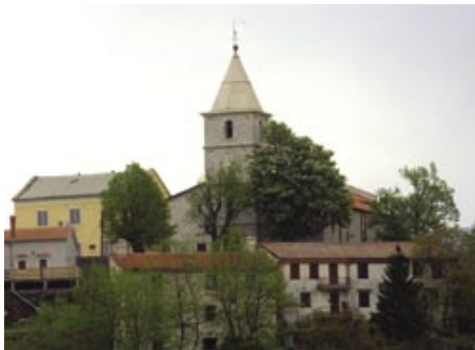
Grad Grobnik: središte župe za koju se kaže da je "od pamtivijeka"

Osim što su bili Isusovi učenici, apostole Filipa i Jakova povezuje i njihovo podrijetlo, oba su rođena u Galiliji, današnjem Izraelu. Sveti Filip je najprije bio učenik Ivana Krstitelja, a potom Isusa. O svetom Jakovu navodimo sljedeće: bio je Isusov bratić, upravljao je Crkvom u Jeruzalemu, napisao je jednu poslanicu Novog zavjeta, živio je vrlo strog život, a mučeništvo je podnio 62. godine.