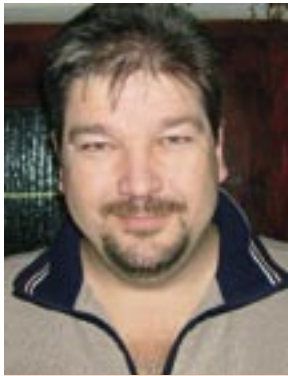
Piše: Robert ZAHARIJA

KULTURA, SPORT I OBRAZOVANJE - PROMOTORI OPĆINE ČAVLE