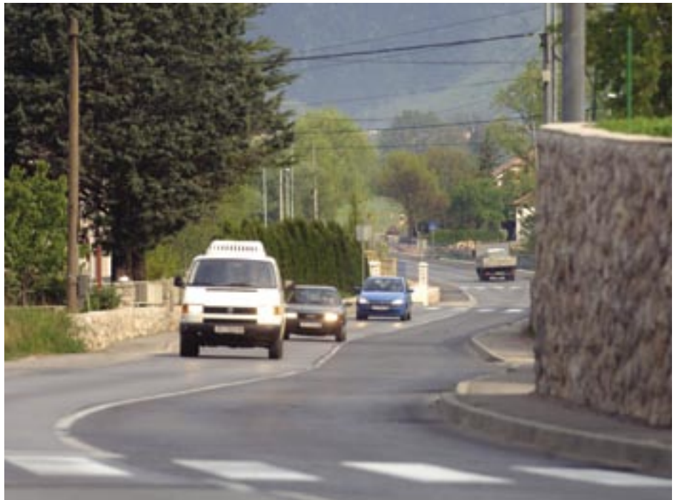
Prometnica Jezero - Podhum preko grobničkog polja dobiti će nogostup i biciklističku stazu

Pri nastanku jedinica lokalne samouprave bilo je dosta problema s granicama, no to nije dobro. Granice ne smiju razdvajati ljude, nego različitosti spajati. Nadam se da se te stvari više neće ponoviti, nego da smo otvorili put ka