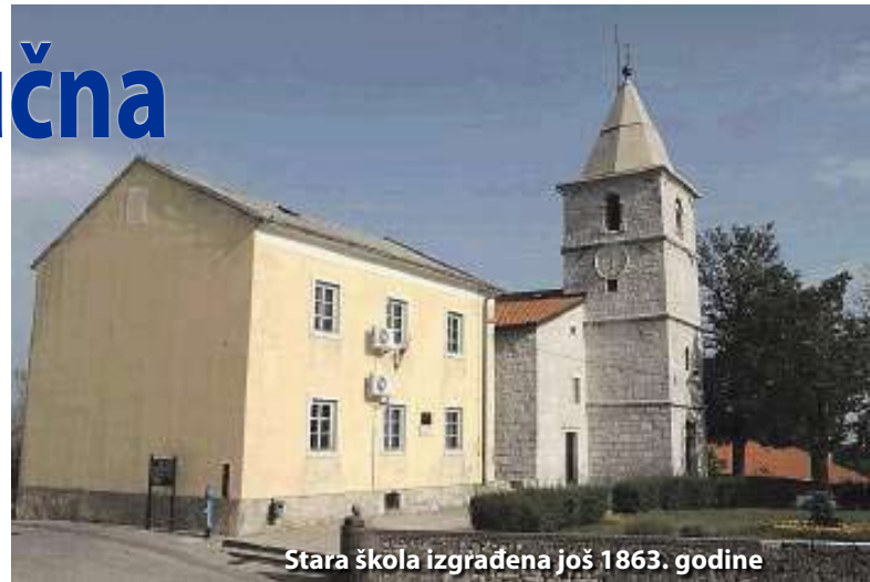
Stara škola izgrađena još 1863. godine

Pripremljena je sva potrebna dokumentacija i odabran izvođač radova koji će izvršiti kompletno uređenje ovog katnog objekta, od rekonstrukcije krovista i sanitarija do uređenja podova i zidova. Također, bit će ugrađeno automatsko plinsko grijanje, čime će se riješiti jedan od gorućih problema koji se javljaju svake zime, s obzirom na to da je ovo jedna od rijetkih škola koja je imala grijanje na drva. Područna škola u Gradu Grobniku, izrađena 1863. godine, jedna je od najstarijih na ovom području koja je još uvijek u funkciji. Tu nastavu prati dvanaest učenika, koji pohađaju školske