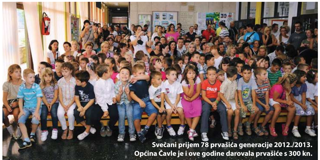
Svečani prijem 78 prvašića generacije 2012./2013. Općina Čavle je i ove godine darovala prvašiće s 300 kn.

Ali, duša svake pa i naše škole su njeni učenici i učitelji te slijedeće redove posvećujem upravo njima. S ponosom smo ispratili naše osmaše i s radošću dočekali novih 78 prvašića; 75 u Matičnoj školi i 3 u