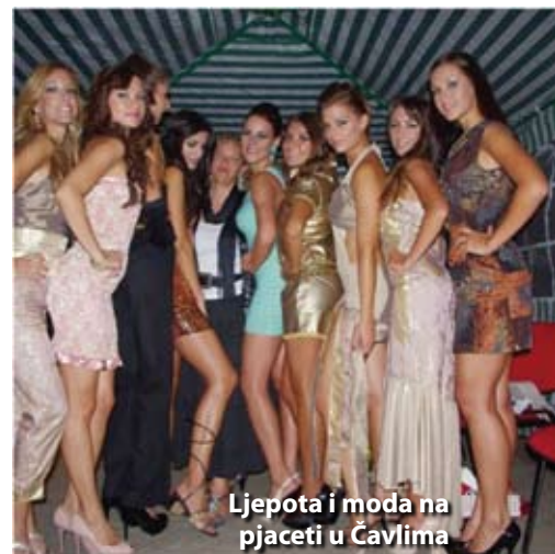
Ljepota i moda na pjaceti u Čavlima