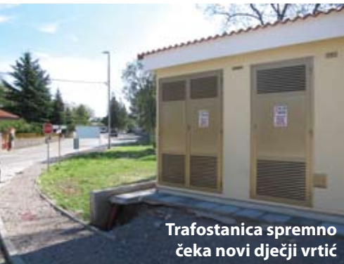
Trafostanica spremno čeka novi dječji vrtić

Radovi za bolji komunalni standard obilježili su i ovo ljeto na Čavlima. Hrvatska elektroprivreda (HEP) postavila je novu trafostanicu, na lokaciji nedaleko od osnovne škole i dječjeg vrtića u Čavlima. Tim novim objektom, koji će biti spojen s trafostanicom u Lišćevici, poboljšat će se električna snaga toga područja, gdje uskoro također kreće i izgradnja novog dječjeg vrtića.