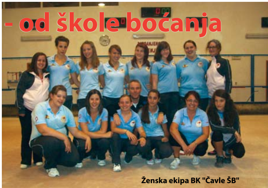
Ženska ekipa BK "Čavle ŠB"

Za ovo kratko vrijeme djelovanja ova ekipa na državnim i županijskim prvenstvima u preciznom, brzinskom i štafetnom