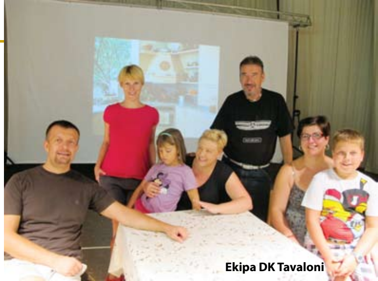
Ekipa DK Tavaloni