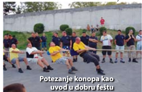
Potezanje konopa kao uvod u dobru feštu

Tko kaže da samo mjesta uz more imaju ribarske fešte. Imaju ih i naše Čavle. Tijekom ljetnih mjeseci u Čavlima su Turistička zajednica i tvrtka Promocija organizirale čak dvije takve veselice. Najprije je 21. srpnja organizirana ribarska uz Koktelse ( zbog bure koncert je održan u Domu kulture ), a nakon toga, 11. kolovoza i fešta uz grupu