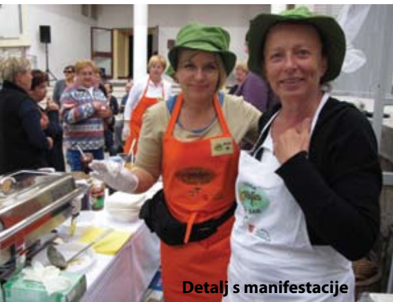
Detalj s manifestacije

Udruga Vidov san za čisti planet, Žensko društvo Grobnišćica i Turistička zajednica Općine Čavle organizirali su humanitarnu manifestaciju Plodovi jeseni koja se održala u subotu 22. rujna od 14 do 18 sati na terasi iza benzinske pumpe na Čavlama. Svi posjetitelji mogli