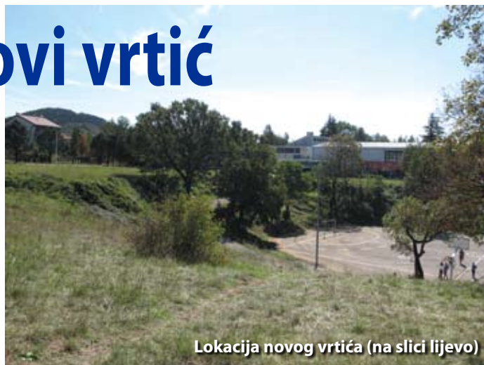
Lokacija novog vrtića (na slici lijevo)

Dječji vrtić Čavlić pod ovim imenom i osnivačem Općine Čavle djeluje od 1. siječnja 2007. godine te je početkom ove godine proslavio svoj peti rođendan. U cjelodnevnom vrtićkom programu upisani su mališani uzrasta od dvije i pol godine pa do sedam godina. Vrtić