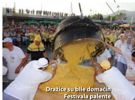
Dražice su bile domaćin Festivala palente

Čak 500 kilograma palente kompirice koja se ove godine kuhala u Dražicama nestalo je u trenu. Naime, i 6. Festival palente i sira koji se tradicionalno održava krajem lipnja naizmjenično u Čavlima i Dražicama, može se reći da je u potpunosti uspio i opravdao svoje postojanje. Palenta