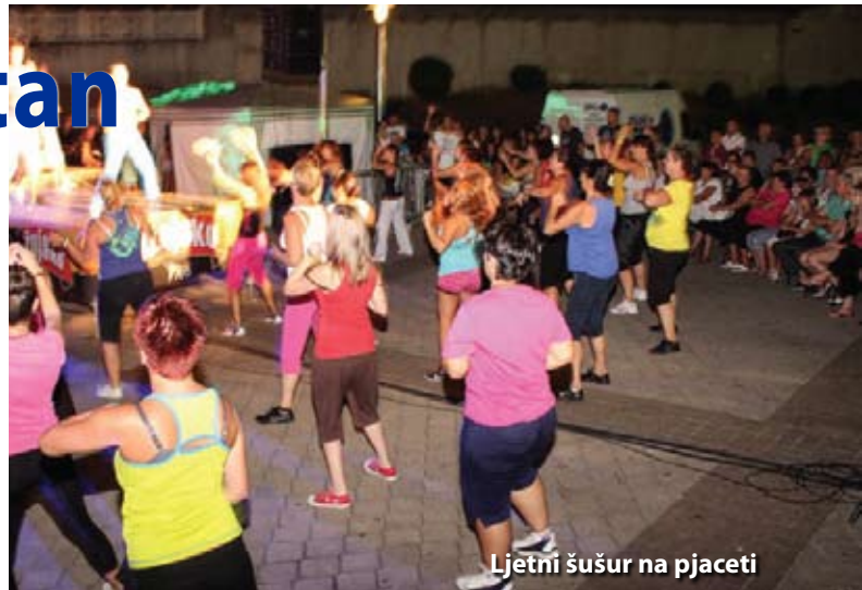
Ljetni šušur na pjaceti

Blagdan sv. Bartola, zaštitnika istoimene cerničke župe, proslavljen je brojnim, raznovrsnim i višednevnim manifestacijama. Organiziran je tako Bartojski kotlić i modna revija, u Čitaonici Cernik je otvorena izložba dječjih radova polaznika radionice i koncert članova Udruge Gromišćina zemlja, a dodijeljene su i nagrade vlasnicima najljepših okućnica i balkona. Od sportskih manifestacija na Autotodromu Grobnik održana je trodnevna manifestacija 59. Utrke Alpe Adria prvenstva, u Bočarskom domu Hrastenica Međunarodni ženski bočarski turnir, na bočalištu BK Cernik tradicionalni bočarski turnir, a na stadionu u Mavrinčima nogometna utakmica između Grobničana i Naprijeda. Bilo je tu i glazbenih poslastica. U Kaštelu Grada Grobnika održan je tako koncert grupe Livingstone pa su mnogi uživali uz glazbu svoje mladosti (rock, blues, funk), a na pjaceti iza Doma kulture održan je veliki koncert Dražena Zečića te Dalmatina i grupe Point. Sve je završilo premijerom predstave