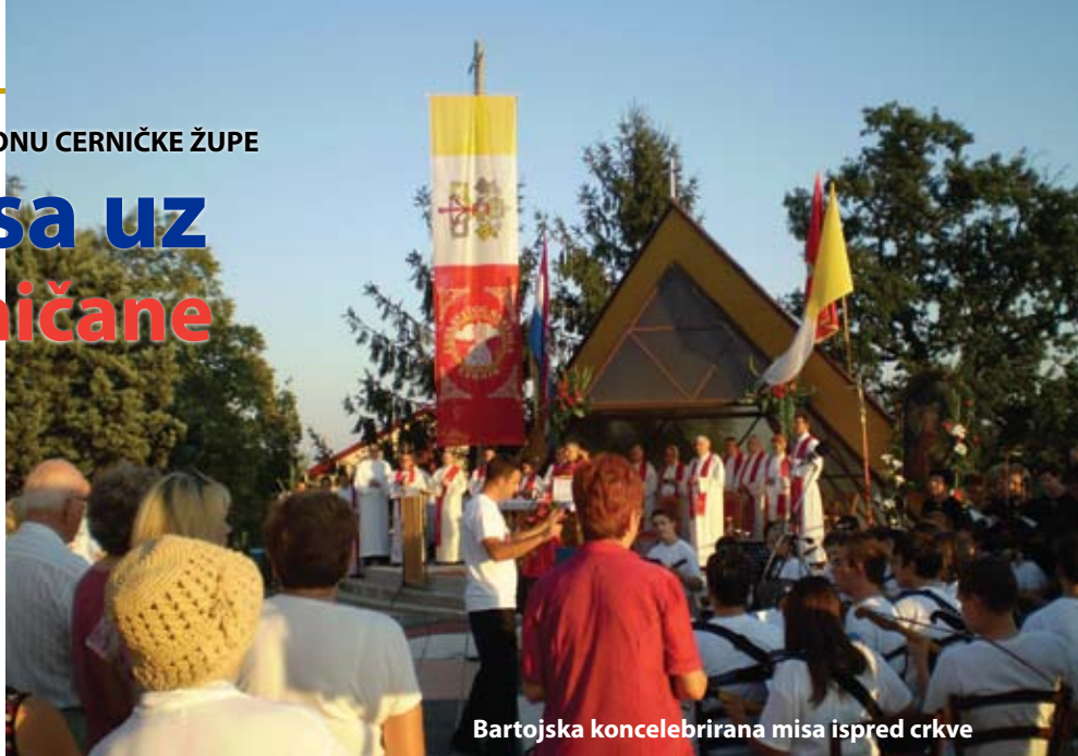
Bartojska koncelebrirana misa ispred crkve

Tradicionalnu večernju koncelebriranu misu, koja se održava ispred župne crkve na sam Dan svetoga Bartola, ove je godine predvodio fra