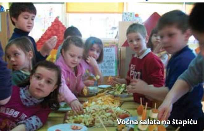
Voćna salata na štapiću

Za Čavliće bistra uma i sjajna oka prođe ova godina u tri skoka!