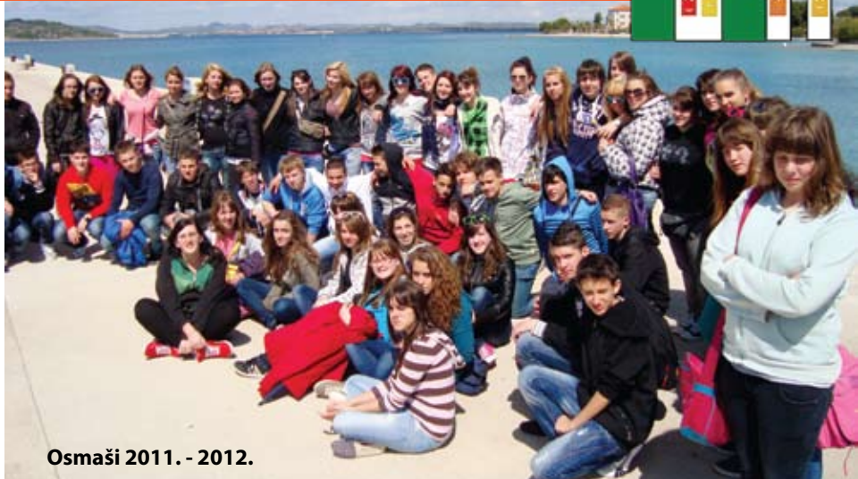
Osmaši 2011. - 2012.

Ovdje izdvajamo tek mali dio iz velike riznice posljednjih uspjeha OŠ Čavle.