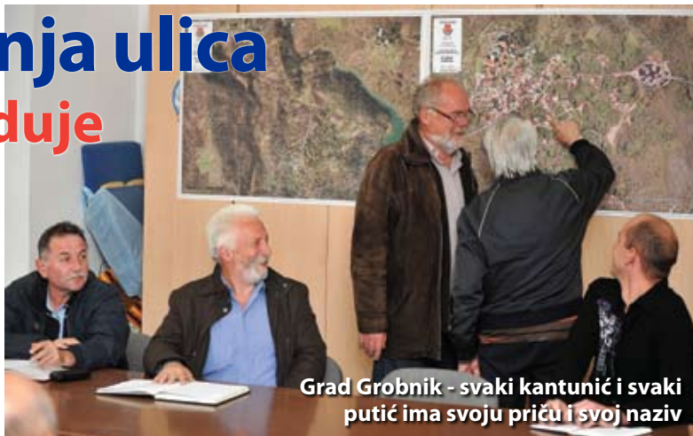
Grad Grobnik - svaki kantunić i svaki putić ima svoju priču i svoj naziv