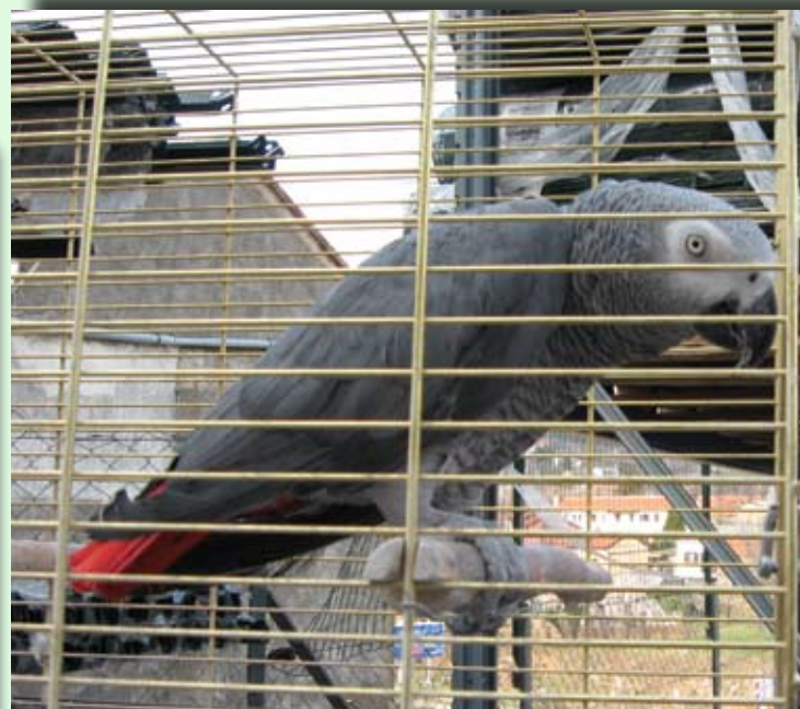
Afrički kraljevski žako u NN Mavrinci