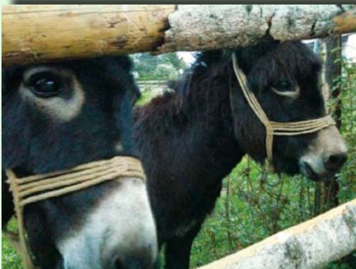
Magarčići u Podrvnju