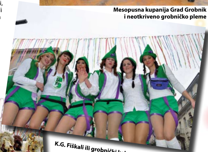
K.G. Fiškali ili grobnički kekeci gredu z Hahlića