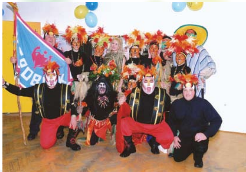
Mesopusna kupanija Grad Grobnik i neotkriveno grobničko pleme

Zaprli smo i ov Mesopust, zapalili toga nesrećnika Šojića, ki j bil kriv za se ča ni vajalo, i si šli doma pripravjat se za sledeći 2013., aš vrime gre jako brzo i to će vaje doć, a dela j čuda.