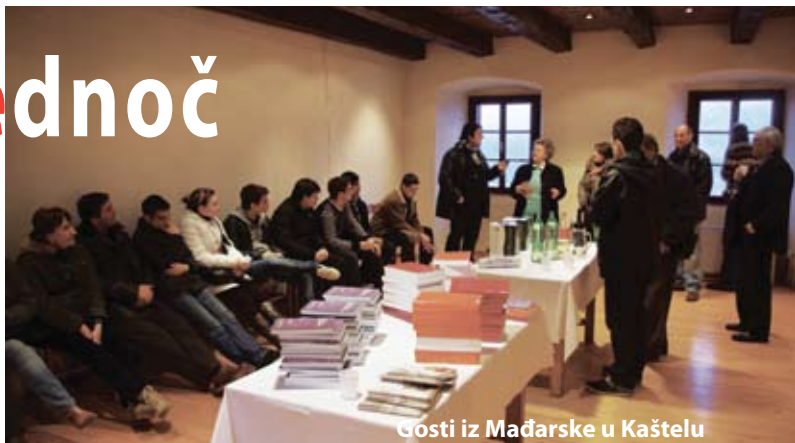
Gosti iz Mađarske u Kaštelu

Po starovjerski znači duboku povezanost sa podsvisnim, instinktivnim svitom za naše ljude. Dolazeći va novu sredinu i okruženje prije sad već skoro pola milenija, druga generacija, - a sve daljnje sve više - čutile polahko nestajanje onog starinskog. Njihovi popovi glagoljaši pa i fratri su polahko nestajali, polahko je nestajala i maša na narodnom jeziku, pa njihova stara pismenost, pa se novim pokoljenjem to sve pričinjalo već pomalo strano, staromodno, izvan „modernih“ tokov, izvan konteksta njihove nove sredine, koju su počeli polako doživljavati kao svoju, i obitavati u njoj, kao