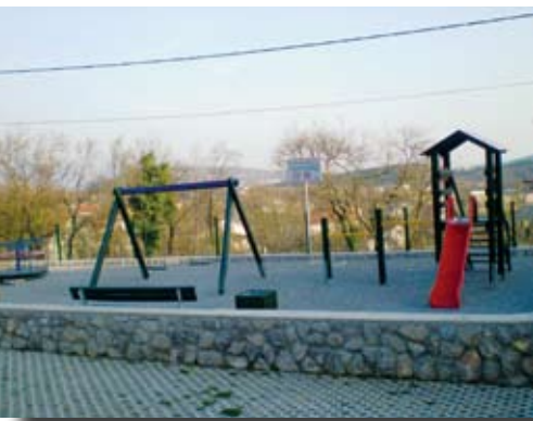
Cernik - Pod vrh

Čarolija, doživljaj i odgovornost Moderan način života uglavnom je usmjeren prema boravku u zatvorenom prostoru, uz neki od brojnih ekrana preko kojih čovjek komunicira s udaljenim ljudima i virtualnom okolinom. Takvi se ekrani nude osobama svih generacija, a jedan od načina njihova prelaska u blizak i realan odnos sa svijetom jesu dječja igrališta na otvorenom, mali dječji parkovi u kojima djeca osjećaju punu čaroliju svoje igre, a odrasli u njihovoj pratnji puni doživljaj vremena i prostora. Dječja igrališta na otvorenom mogu biti opremljena s više ili manje različitih naprava za igru, kao što su ljuljačke, tobogani, vrtuljci, klackalice, penjalice, vratila i mnoge druge. Osim što djeci omogućuju igru, rekreaciju i zabavu, ove naprave pomažu i njihovom pravilnom tjelesnom razvoju. No uza sve to, boravak na dječjem igralištu zahtjeva punu pozornost i odgovornost odraslih. Mada Općina i proizvođač opreme prethodno urade sve za sigurnu igru, zbog protoka vremena, te nepažnje i neodgovornosti pojedinaca uvijek je potrebno provjeriti ispravnost naprava, čistoću pijeska i vršiti stalan nadzor nad djecom. Zbog toga svako igralište ima i tablu s upozorenjem.