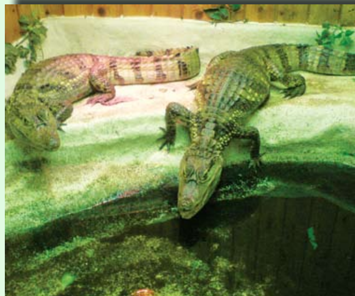
Južnoamerički kajmani u Žeželovom selu