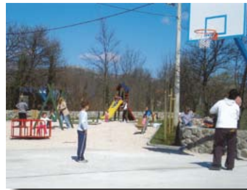
Gorice - Bajta