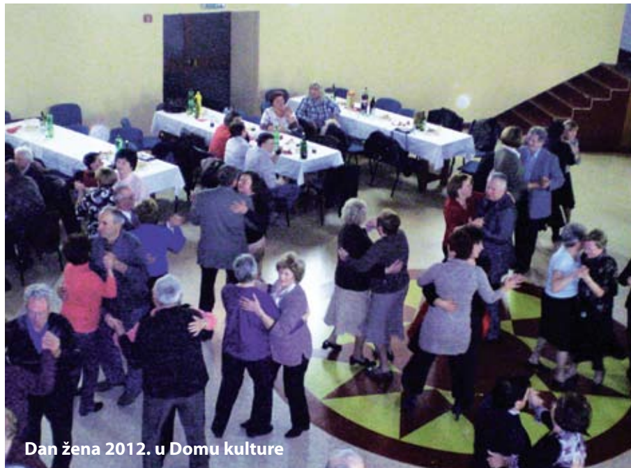
Dan žena 2012. u Domu kulture