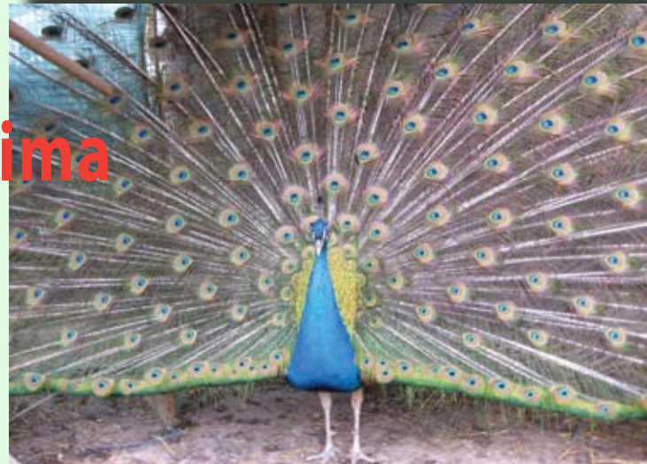
Azijski paun u vrtu u Dražini