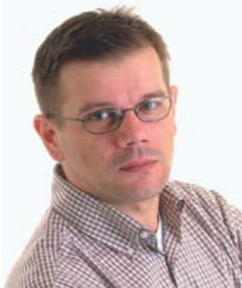
Piše: Dražen Herljević