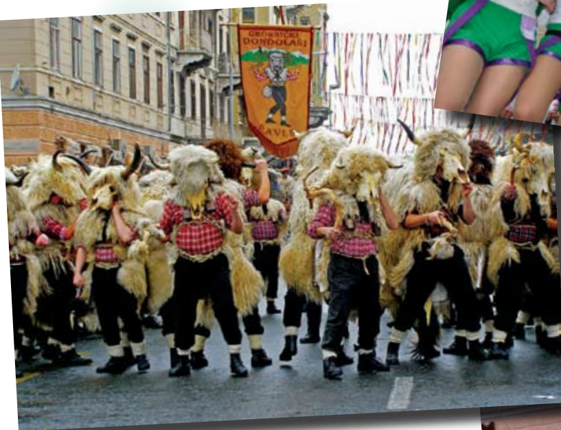
Dondolaši – posebna atrakcija riječkog karnevala