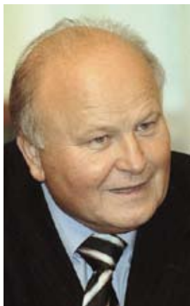
Slavko Linić, ministar financija