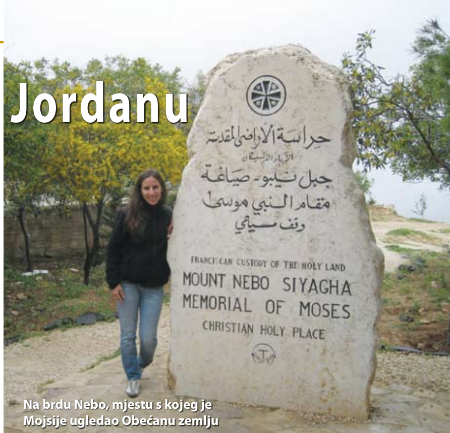
Na brdu Nebo, mjestu s kojeg je Mojsije ugledao Obećanu zemlju

Ono što Jordan najviše čini posebnim, to je pustinja Wadi Rum. Ljudi odlaze u nju da se opuste od svakidašnjeg ubrzanog ritma. Prekrasna priroda, tišina, pokoja deva ili stado ovaca, te neopisivo noćno nebo prepuno zvijezda, osobito kad mjesec nije pun. U Jordanu se nalazi i jedan veličanstveni drevni grad u stijenu, Petra, mjesto koje se ne propušta, a zbog kojeg u ovu zemlju dolazi većina turista. Ljubitelji Indiane Jones znaju da se jedan od filmova snimio upravo u Petri, gradu koji nikog ne ostavlja ravnodušnim, a gotovo je nevjerojatno da su ljudi sve donedavno živjeli u njegovim stijenama.