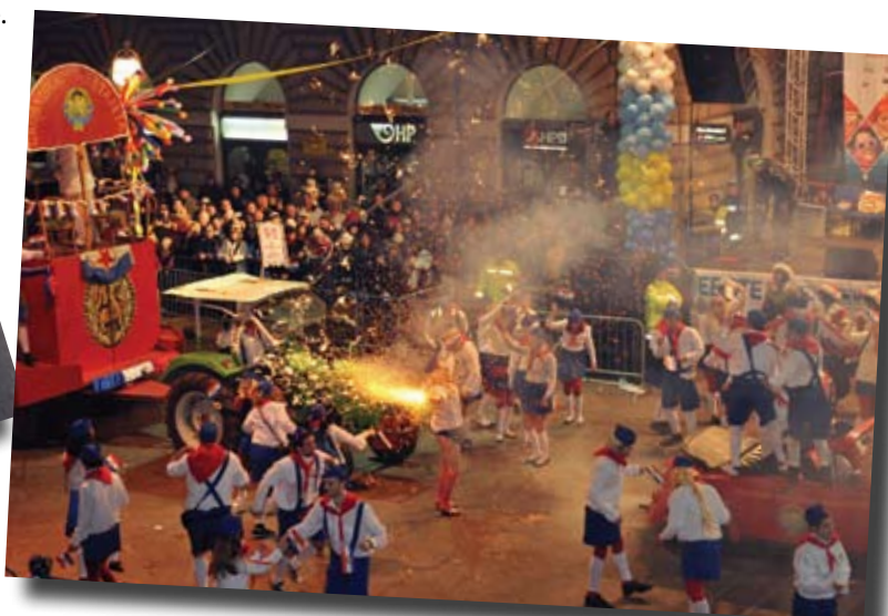
Grobnički pioniri nosili štafetu