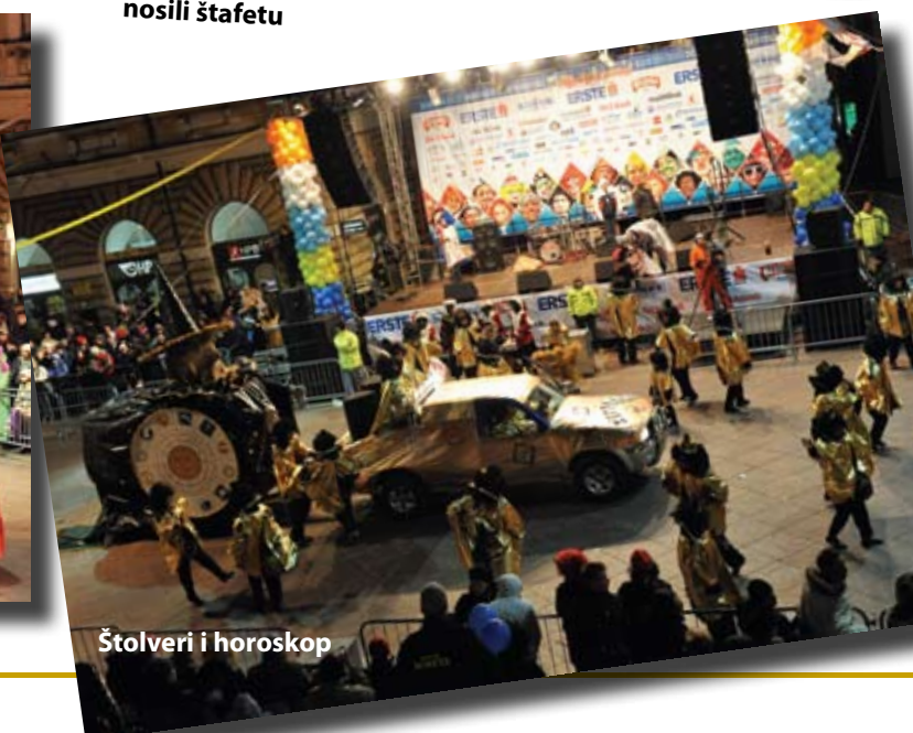
Štolveri i horoskop