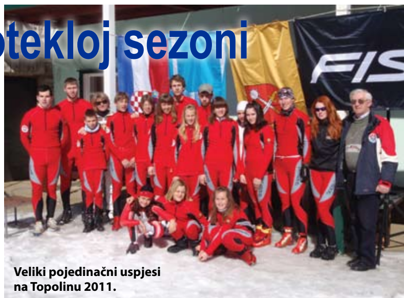
Veliki pojedinačni uspjesi na Topolinu 2011.

Kao i svake godine, klub je i ove godine odradio zimske pripreme u trajanju od tjedan dana na Platku. Redoviti treninzi kojima se održava dobra forma, odrađuju se svakodnevno u dvije grupe ovisno o školskoj smjeni, što dodatno otežava rad i naravno poskupljuje ionako visoke troškove odlazaka na trening, pogotovo na Platak. No zahvaljujući entuzijazmu svih u klubu, a