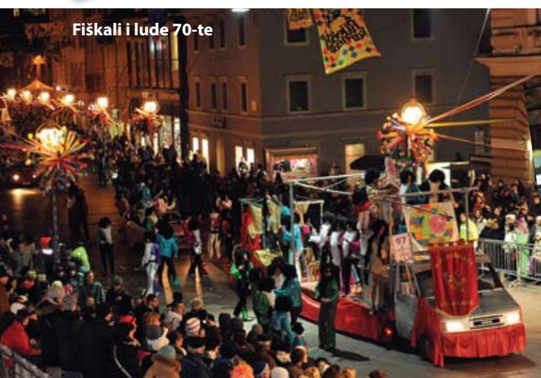
Fiškali i lude 70-te