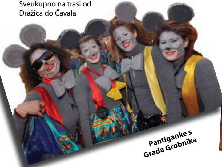
Pantiganke s Grada Grobnika

predstavilo se 400 učesnika. Dan kasnije održano je i jubilarno 10. izdanje »Maškaranog Platka«, na kojem se okupilo čak 500-njak maškara i još mnogo veselih posjetitelja koji su uživali u mnogo smijeha u proljetnom danu na Platku.