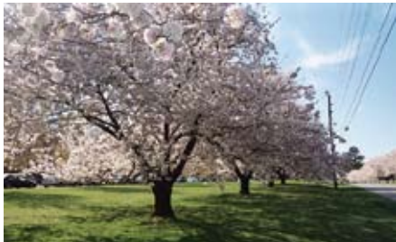
Sadnjom voćaka i drenažom zemljišta smanjilo bi se i poplavljanje polja

Predstavnici Agronomskog fakulteta u Zagrebu sa Zavoda za ishranu bilja prezentirali su pred članovima Općinskih