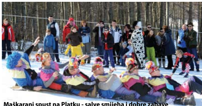
Maškarani spust na Platku - salve smijeha i dobre zabave

Uspješan je bio i Grobnički maškarani vikend koji čini atraktivna grobnička zvončarska smotra – Grobnišćina zvoni. Uz domaće dondolaše mogli smo vidjeti Džolamarije iz Makedonije, Krampuse iz Austrije i Korante iz Slovenije, te domaće Čićeške, Munske, Zametske, Žejanske i Kujukanske zvončare i Griške Krabunose. Sveukupno na trasi od Dražica do Čavala