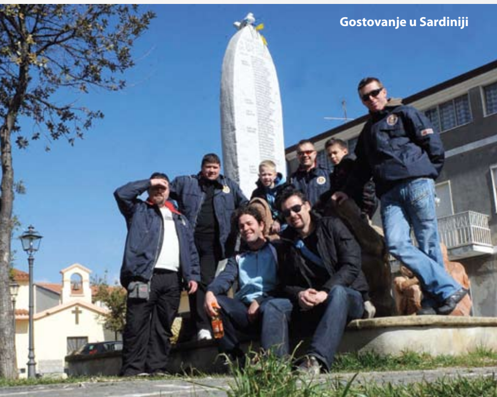
Gostovanje u Sardiniji