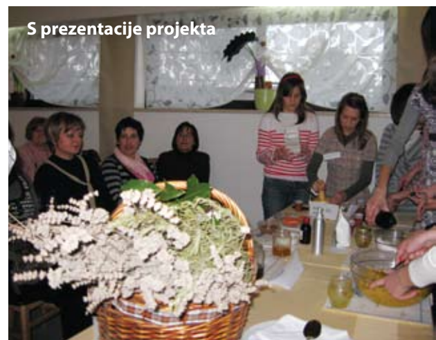
S prezentacije projekta