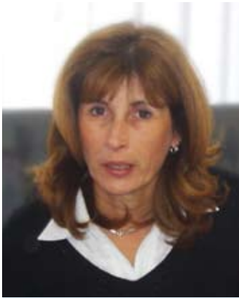
Piše: Tanja Stanković