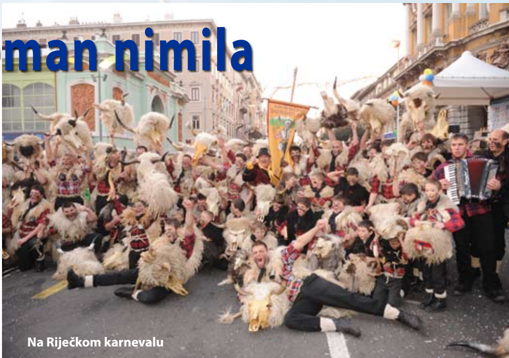
Na Riječkom karnevalu

Drugo gostovanji j bilo puno napornije, aš smo šli va mesto Mamoiada na Sardiniji va uzvratni posjet grupi Mamuthones e Issohadores, ka j bila pu nas lani. Ti četiri dani smo pasali 2000 km, dve noći proveli na trajektu, razgjedali Livorno i Pisu, obašli muzej tradicijskih mask Evrope. Uz