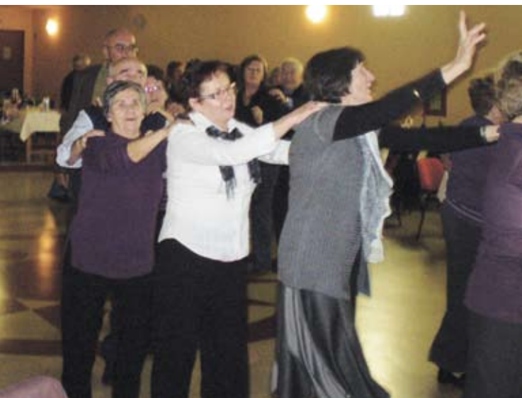
Mlada i vesela srca umirovljenika ne mogu omesti nikakve «Vakuline» ciklone i snježni pokrivači

Unatoč snijegu koji je u popodnevnim satima toga dana uporno padao i uvelike blokirao cestovni promet, te onemogućio dolazak mnogih umirovljenika i dijela najavljenih glazbenika, ova je sedma uzastopna Večer pokazala da mlada, snažna i vesela srca umirovljenika mogu biti jača od svih «Vakulinih» ciklona i snježnih pokrivača.