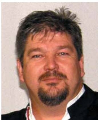
Piše: Robert Zaharija

Ča da van rečen, stišće se kuliko je ponjava duga, ni više ni manje. Evo i na Gmajni smo zrizali, neće bit saka dva miseca ko do sad, bit će četiri mesto šest brojih na leto