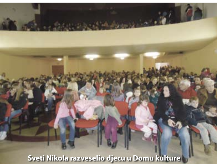
Sveti Nikola razveselio djecu u Domu kulture

S ovim završavaju aktivnosti DND za 2010. godinu, a već u siječnju s jednakim entuzijazmom nastavljamo dalje! Svim čitateljima želimo ugodne, blagoslovljene i mirne blag dane, ispunjene radošću i veseljem u krugu najmilijih!