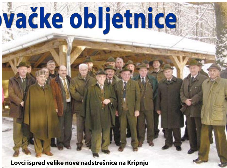
Lovci ispred velike nove nadstrešnice na Kripanju

Nadstrešnica je otvorena uz sudjelovanje velikog broja lovaca i uzvanika, a blagoslovio