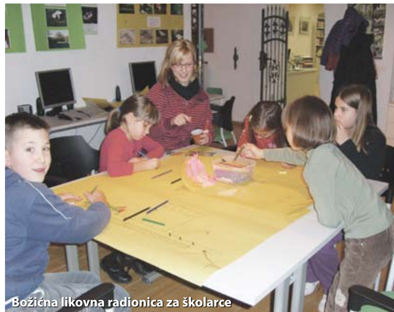
Božićna likovna radionica za školarce

U nekoj elegantnom zdanju u središtu Kaira prebiva raznolika galerija likova: propali aristokrat, samozvani "proučavatelj žena", zvodnica bujnog tijela, mladi student kojega neodoljivo privlači fundamentalizam... Svaki precizno ocrtan lik utjelovljuje neko obilježje suvremenog Egipta gdje su politička korupcija, nepošteno stečeno bogatstvo i vjerska hipokrizija prirodni saveznici. "Impresivan pogled na društvo i kulturu današnjeg Egipta."