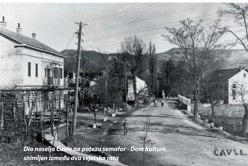
Dio naselja Čavle na potezu semafor - Dom kulture, snimljen između dva svjetska rata

Vrlo je vjerojatno da ime Čavle dolazi od čavji, određenih depresija-vrtača kojima obiluje ovaj lokalitet, a koje su vjerojatno u dalekoj prapovijesti nastale meteorskom kišom