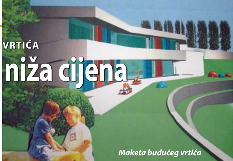
Maketa budućeg vrtića

Na spomenuti način biti će moguće ostvariti i značajne uštede sve skuplje