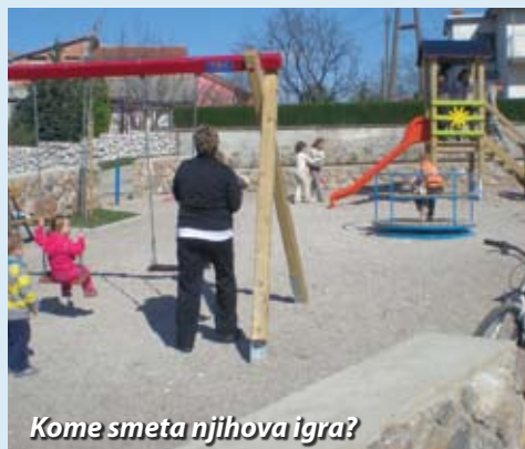
Kome smeta njihova igra?