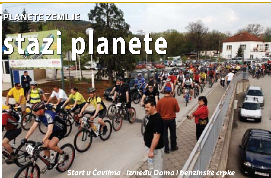
Start u Čavlima - između Doma i benzinske crpke

Utrka je bila zatvorenog tipa od centra Čavala do Rastočina, gdje je bio i start utrke. Sama utrka trajala je u prosjeku oko sat i 45 min, sa svojih 23 km po relativno zahtjevnom terenu. U Lisacu su po završetku utrke dodijeljene nagrade i pobjednički pokali, nakon čega su natjecatelji dobili zaslužni ručak. Rekreativna biciklijada od Rastočina se nas-