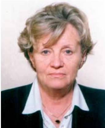
Piše: Nada Luketić

Prihodi su u odnosu na isto razdoblje prošle godine znatno manji, a posebno s osnova poreza na dohodak koji bilježi veliki pad od 16 posto. Kako prihod od poreza na dohodak u ukupnim proračunskim prihodima Općine Čavle sudjeluje s 53 posto, pad ovog prihoda rezultira i značajnim ukupnim padom