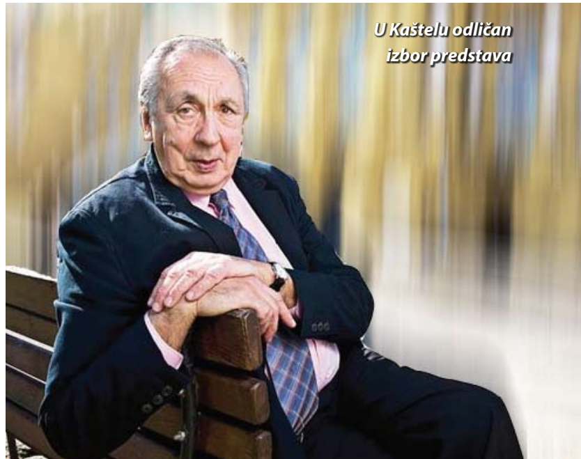
U Kaštelu odličan izbor predstava

To je bio čovjek vispren, kojeg je život naučio snalaženju u različitim situacijama. Bio mi je užitak igrati tako zanimljivu osobu