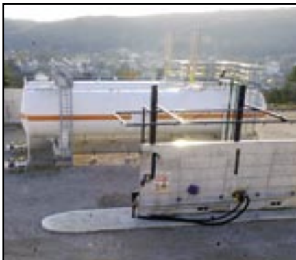
Plinska stanica na Čudniću