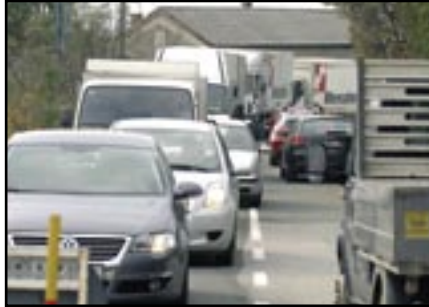
Radovi na kanalizaciji, unatoč reguliranju prometa semaforima, stvaraju velike gužve.

ističe u ime investitora glasnogovornica Vodovoda i kanalizacije Mojca Spinčić.