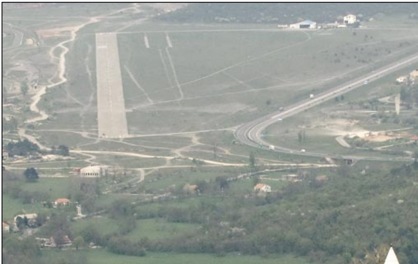
Grobničko polje: Zona za razvoj sportskih i komercijalnih sadržaja

Prostorni plan Primorsko-goranske županije predviđa odgovarajuće