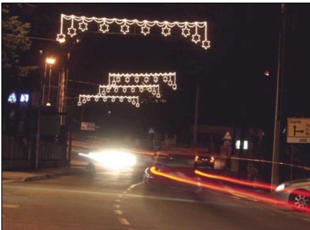
U 2007. godini Općina Čavle nastavlja snažan napredak