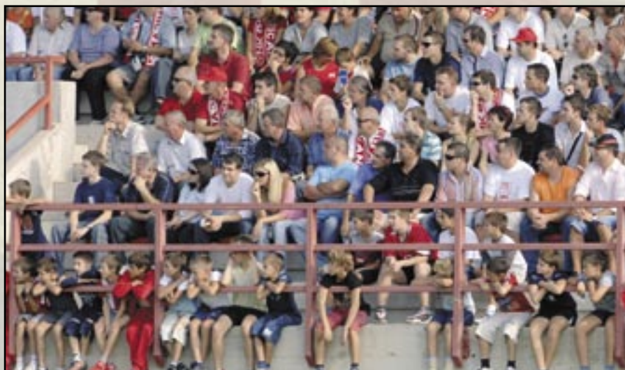
«Grobničan se voli od mala»

U Mavrincima je, možemo reći, «Grobničan» izgubio u sportskom nadmetanju, ali je čitava Grobnišćina dobila sportski događaj za povjest. Bio je to istovremeno i njen nogometni praznik i potvrda njenog sportskog identiteta. Nogometaši koji su toga dana molili u svojim poduzećima za slobodan dan potvrdili su mogućnost igranja protiv vrhunskih profesionalaca, sportski djelatnici sposobnost organizacije velike sporske priredbe, više od dvije i po tisuće gledatelja visoku kulturu sportskog navijanja, a općinski dužnosnici i svi mještani privrženost «Grobničanu», sportskom simbolu zajedništva.