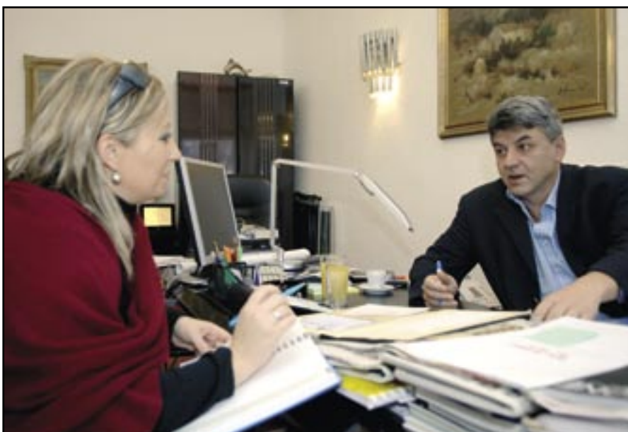
Komadina: Mještani Čavala su stvarno neumorni. Poznati su obrtnici, angažirani su u očuvanju naše čakavice, ali i sportskim udrugama