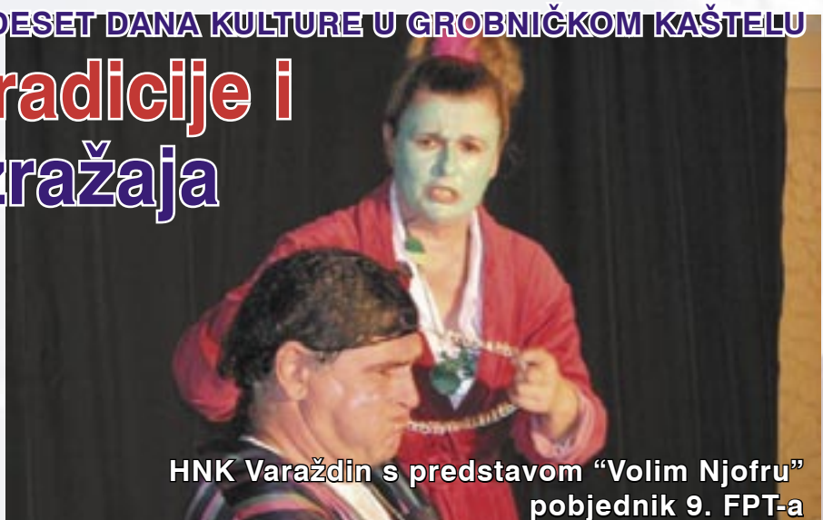
HNK Varaždin s predstavom "Volim Njofru" pobjednik 9. FPT-a

Osim događanja koja su promovirala tradiciju i klasični izričaj, publika je mogla pogledati i predstavu poznatog imitatora Denisa Bašića u kojoj je glumac oponašajući poznate osobe, poput Tuđmana, Mesića, Rojsa i Ćire Blaževića, nasmijavao publiku. Posebice je upečatljiv bio nastup Putokaza čiji je svaki koncert predstava u malom, kao i festivalska