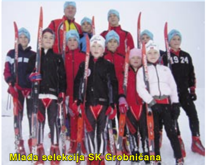
Mlađa selekcija SK Grobničana

Nakon uspješne skijaške sezone i osvajanja 2. mjesta u ukupnom zbroju svih 8 utrka Hrvatskog pokala mladi skijaši SK Grobničana krenuli su drugu godinu za redom na rolerske utrke u Italiju.