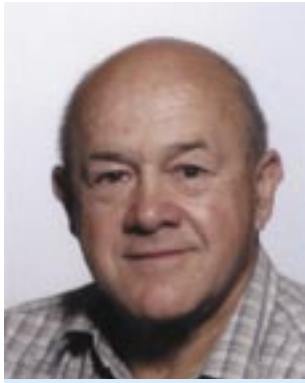
Piše: Arsen Salihagić