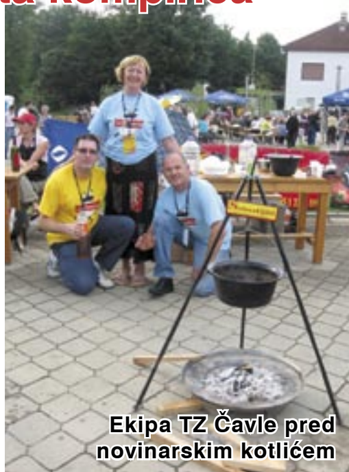
Ekipa TZ Čavle pred novinarskim kotlićem

Festival su obogatili 9. prvenstvo Hrvatske u kuhanju lovačkog gulaša u kotliću za novinare, na kojem je sudjelovalo čak 14 ekipa, te prodaja suvenira s temom palente i sira, izrada prigodnog novčića, prezentacija života čobana na konaku, dječji crteži, zatim kulturno-umjetnički program u kojem je sudjelovao KUD Zvir, klapa Grobnik te Kvartet Krajner. Okupljene na trgu iza Doma kulture do kasnih večernjih sati zabavljao sastav Aurora.