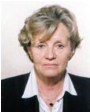
Piše: Nada Luketić

Kredit za sportsku dvoranu od 20 milijuna kuna odobrila je Hrvatska banka za obnovu i razvoj uz kamatnu stopu od 4 posto godišnje i rok otplate od devet godina, od čega su dvije godine počeka. Kredit se otplaćuje u tromjesečnim ratama, a prva dospijeva na naplatu 31. 03. 2011. godine