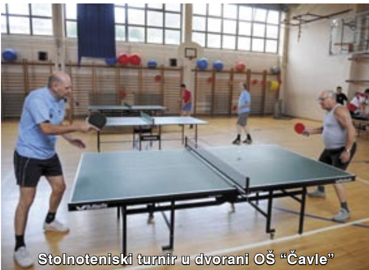
Stolnoteniski turnir u dvorani OŠ "Čavle"

U povodu Dana pobjede i domovinske zahvalnosti te Dana hrvatskih branitelja, 5. kolovoza, kao i 14. godišnjice vojno-redarstvene akcije Oluja te u znak sjećanja na poginule hrvatske branitelje s područja Grobnišćine, Udruga hrvatskih dragovoljaca Domovinskog rata Grobnišćine organizirala je prigodan program koji je počeo polaganjem vijenaca na groblju Jelenje, Cernik i Grad Grobnik, gdje je održana i misa za poginule branitelje. U dvorani Osnovne škole Čavle tradicionalno je održan stolnoteniski turnir, a na školskom igralištu Jama odigrao se malonogometni turnir. Sve je završilo zabavnim programom uz grupu Fiesta.