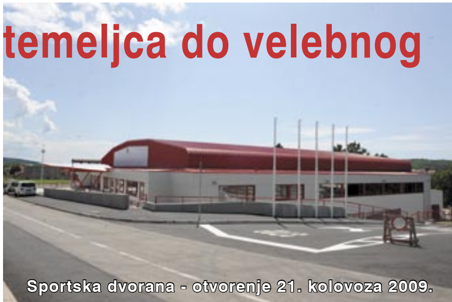
Sportska dvorana - otvorenje 21. kolovoza 2009.