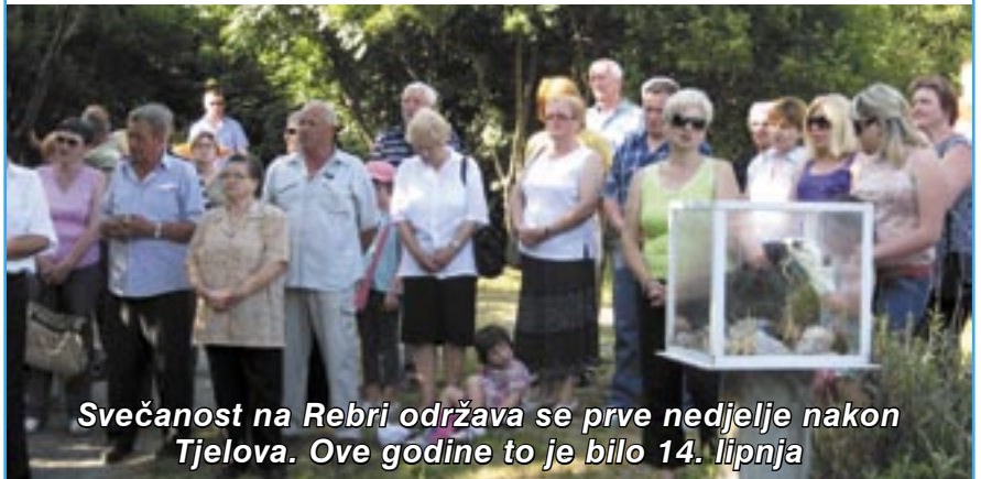
Svečanost na Rebri održava se prve nedjelje nakon Tjelova. Ove godine to je bilo 14. lipnja

I ponovo su sjećanja na mater mlikaricu ispunila srce i dušu svih sudionika ove dostojanstvene svečanosti s velikim i jakim emocijama. Osmi put kao i prvi put. I kao svaki put kada svoje vrijeme i svoju pozornost posvetimo majci.