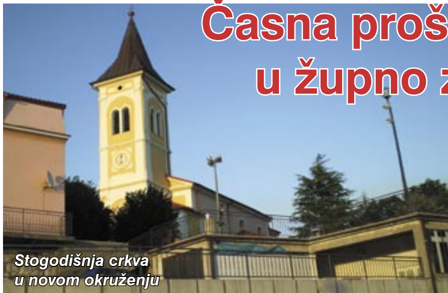
Stogodišnja crkva u novom okruženju