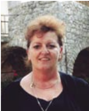
Piše: Vlasta Juretić

Od 1991. do 1995. godine, za vrijeme Domovinskog rata odumirale su brojne kolonije, koje su širom Hrvatske radile od sredine prošlog stoljeća, ali su se poslije njega pojavile nove – grobnička kao prva.