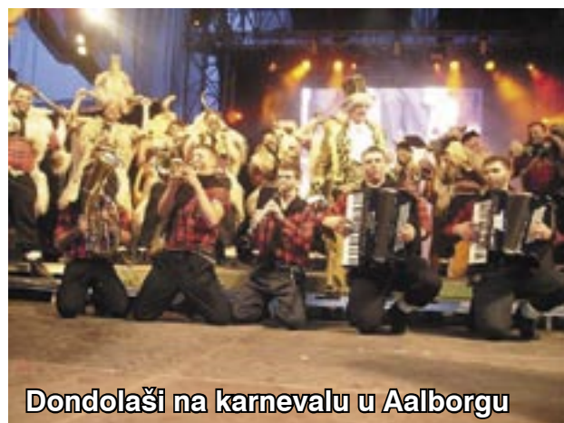
Dondolaši na karnevalu u Aalborgu

Vidin da mi ponestaje prostora, a va našoj se Općini tuliko toga dogaja da bi Gmajna morala bit tjednik, kako bimo mogli pisat na dugo i široko. No moran van još reć da smo proveli akciju čišćenja okoliša škole na Čavji, a sad tribamo pomoć Turističkoj zajednici va organizaciji Festivala palente i sira, čemu se jako veselimo.