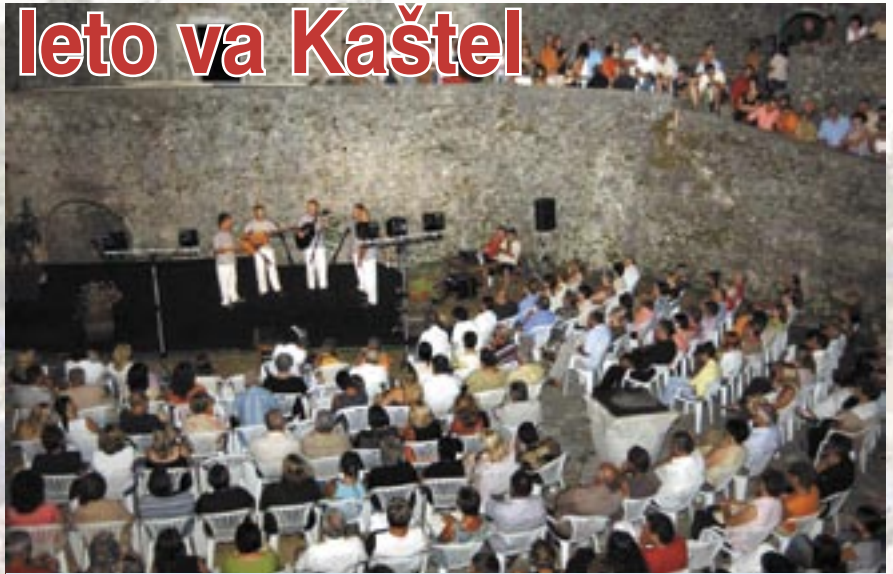
U grobnički Kaštel s ljetom stižu razne predstave, koncerti, izložbe...

Festival pučkog teatra održat će se od 4. do 12. srpnja, a Susret klapa 1. i 2. kolovoza