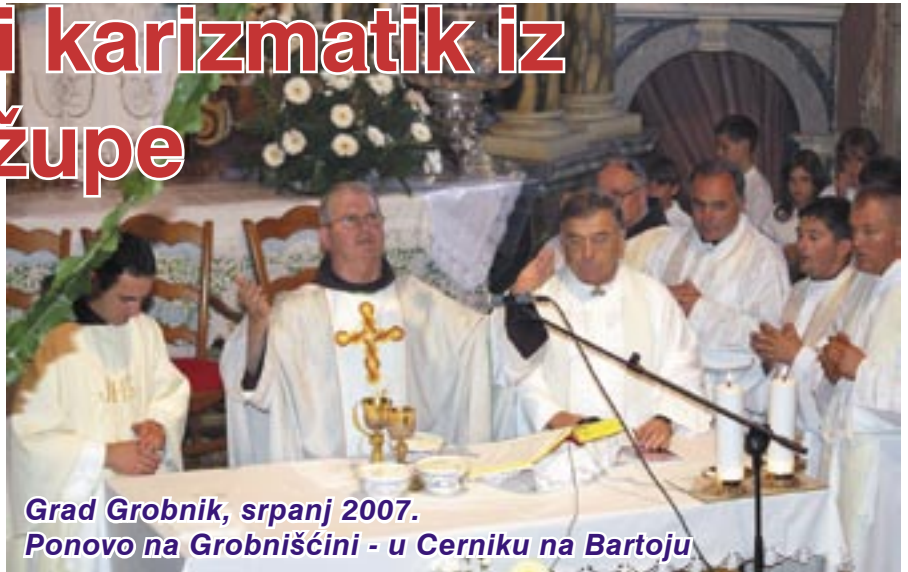
Grad Grobnik, srpanj 2007.

Utjecaj obitelji u vrijeme mojeg djetinjstva bio je svakako veći i dublji