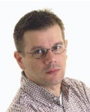
Piše: Dražen Herljević

Palenta j zapravo sirotinjska hrana, malo žute muke i kompira, i to j to. Nju si j mogal saki priuštit, grobnički sir baš i ne. Palenta se j jila i pojila (mesto kruha), opolne ju storiš, večer je više ni, a grobnički sir je bil prava delikatesa, on se j jil na malo i dural je više dan