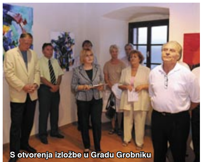
S otvorenja izložbe u Gradu Grobniku

I na kraju, po onome kako bi naši prijatelji iz Njemačke kazali: Zucker kommt zuletzt , odnosno šećer dolazi na kraju . Svih nas u grobničkoj Čakavskoj katedri posebice veseli što smo s našim prijateljima iz Njemačke podijelili izuzetno radovanje i upravo s otvaranjem ove izložbe, na najbolji mogući način, svečano obilježili deset godina Galerije suvremene umjetnosti Grobnik. Naime, Galerija je službeno otvorena 31. svibnja 1999. godine!