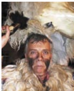
Piše: Nikola Vrančić-Kolja