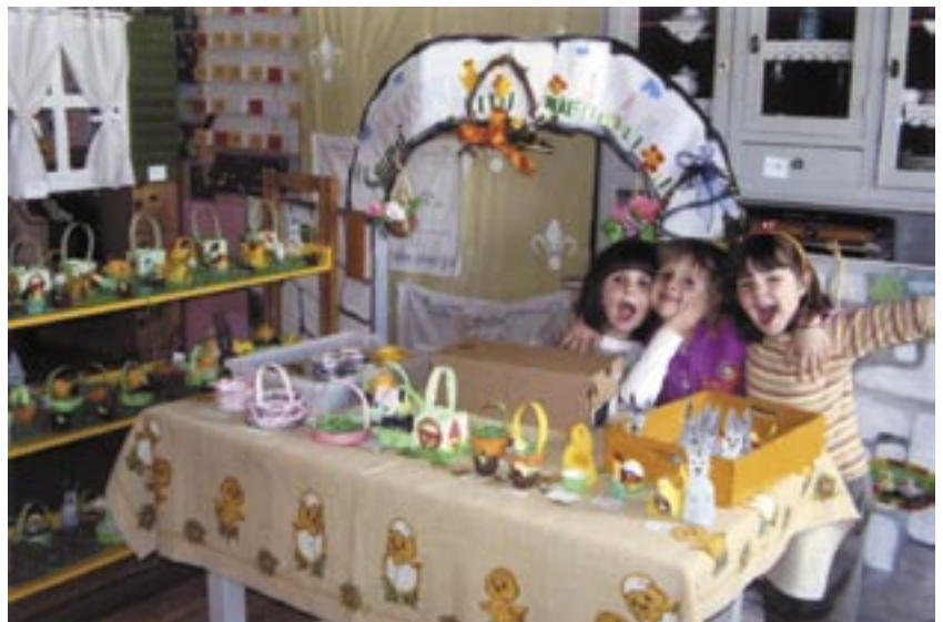
Maleni proizvođači i prodavači: Njihov jedini profit je radost

Unutar vrtića također organiziramo radionice za odgojitelje u kojima sa stručnim suradnikom raspravljamo o novim metodama, načinima i principima rada kako bi cijeli odgojno-obrazovni proces, koji se odvija u našem vrtiću, prošao na zadovoljstvo djece, roditelja i nas zaposlenika.