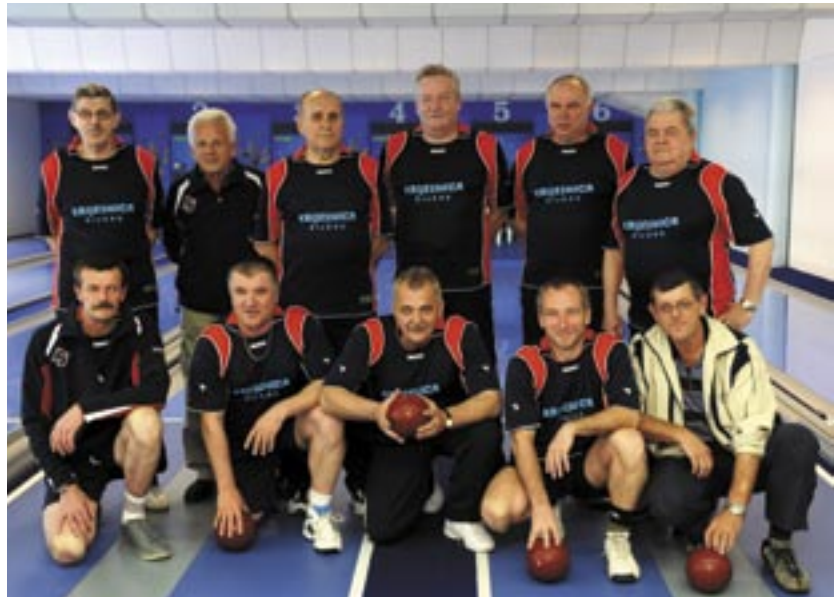
Prvo mjesto KK "Grobničan RB" u Četvrtoj ligi- zapad osigurali su već pet kola prije kraja