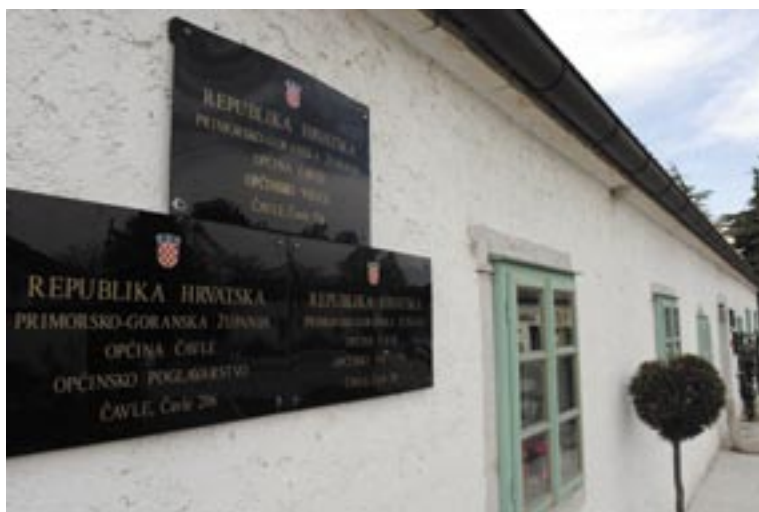
Stupanjem na dužnost Općinskog načelnika izabranog na neposrednim izborima Općinsko poglavarstvo prestaje s radom

Pored toga, Zakon obvezuje općinskog načelnika na nazočnost sjednicama općinskog vijeća, a ono u određenim slučajevima može raspisati i referendum o njegovu razrješenju. Mogućnost raspisivanja ovog referenduma Zakon predviđa u dva slučaja: prvi je ako vijeće ocijeni da načelnik krši ili ne izvršava njegove odluke, a