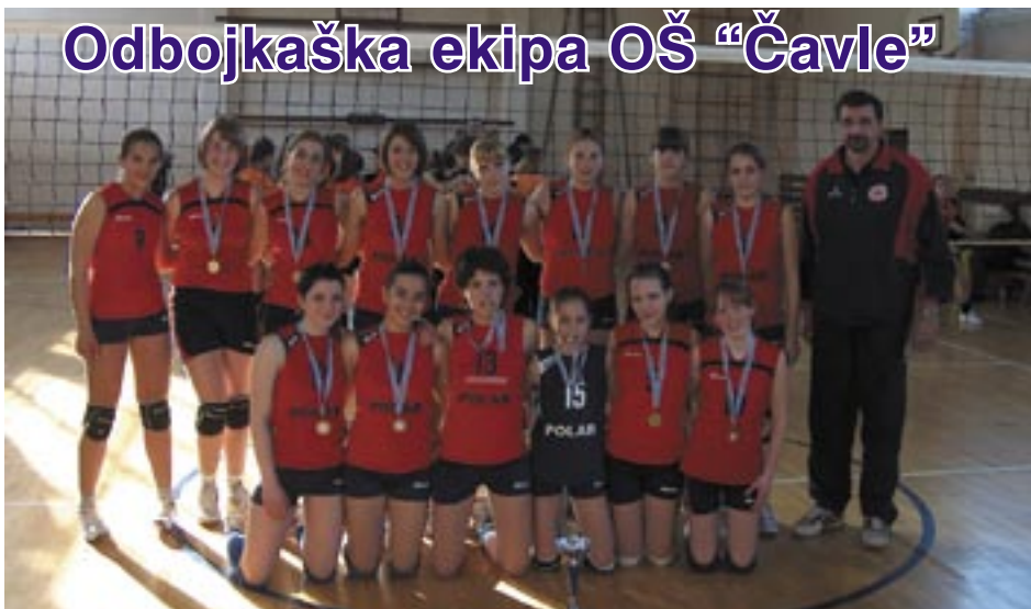
Stopama OK Grobničan: Odbojkašice OŠ Čavle izborile su plasman na Završno državno prvenstvo koje će se održati u svibnju u Šibeniku