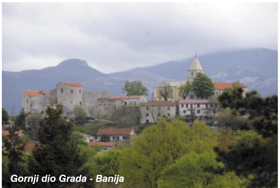
Gornji dio Grada - Banija

Na placi je još i danas kameni postament spomenika župniku Martinu Juretiću, takozvani Štandard. Samo malo iznad njega i preko puta, u zidu takozvane Rožine šterne, nalazi se isklesani kamen Slinava baba, ili samo Baba. Uputimo li se desno od Babe starim kamenim stepenicama ravno prema gore u smjeru crkve kroz, kako kažu autohtoni Grajani, Stražnicu, doći ćemo do jedne velike zgrade, župnog stana Plovanije. Tada možemo birati put, lijevo stepenicama u crkvu, ili iza crkve i Kaštela u Barbakan, Belveder ili Zagrad. Pođe li se pak lijevo od Babe cestom uzbrdo dolazimo na Baniju, kako se zove gornji dio Grada, odnosno do Kaštela, škole (jedna od