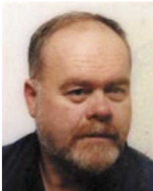
Piše: Veljko Franović

O Gradu Grobniku, ili za autohtone Grobničane samo Gradu (u daljnjem tekstu samo Grad), toliko je napisano da bi za jednu razglednicu trebalo mnogo mjesta, mnogo više prostora od ove dvije stranice „Gmajne“. Tako je u dosadašnjih osam izdanih svezaka Grobničkog zbornika gotovo tri četvrtine sadržaja posvećeno ovoj utvrdi i ovome mjestu bogate povijesti, a k tome još treba