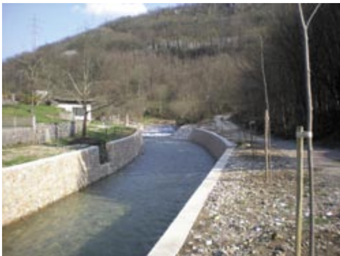
Pošumljavanje i čišćenje ušća Sušice u Rječinu

Tijekom travnja, zajedničkom akcijom komunalnih redara Općina Čavle i Jelenje Dragomira Sudana i Zvezdana Juretića, članova Sportsko-ribolovnog kluba Rječina te mještana Lukeža pošumljen je teren kod ušća Sušice u Rječinu. Akciju su pomogli privatni obrtnici koji su osigurali prijevoz, gnoj i humus, a podržale su je Općine Čavle i Jelenje te Komunalno društvo Čavle. Posađeno je tridesetak lipa i hrastova. Radna akcija nastavljena je prošle subote čišćenjem okoliša te postavljanjem klupa i stolova.