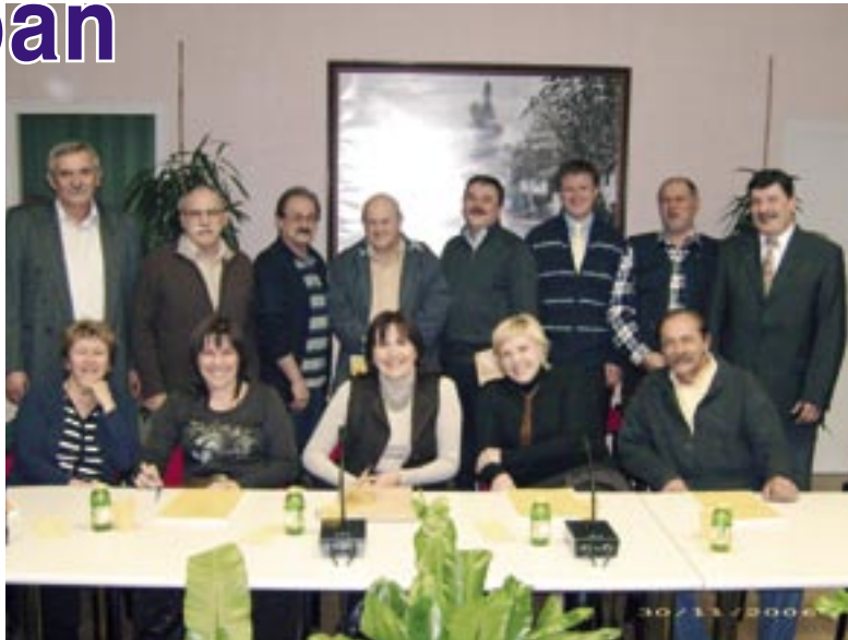
Sastav Općinskog vijeća Općine Čavle od 2005. do 2009.

Uvođenje neposrednog izbora izvršnih čelnika lokalne i područne samouprave naišlo je na odobravanje i javnosti i stručnih krugova i samih saborskih zastupnika, koji su ovu promjenu izglasali velikom većinom glasova, pa se zbog toga očekuje i znatno veći odaziv birača nego na ranijim lokalnim izborima