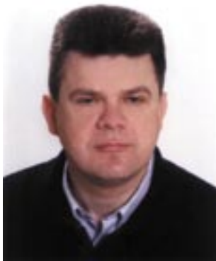
Piše: vlač. Ivan Friščić

Povodom svetkovine sv. Filipa i Jakova koja se tradicionalno slavi 1. svibnja na međunarodni Dan rada, kada se slavi i sv. Josip, radnik, kao zaštitnik Hrvatskog sabora i hrvatskog naroda, želim vam uputiti prigodnu čestitku, te vas potaknuti na promišljanje o ulozi vjere u životu, kako pojedinca, tako i naše Grobnišćine.