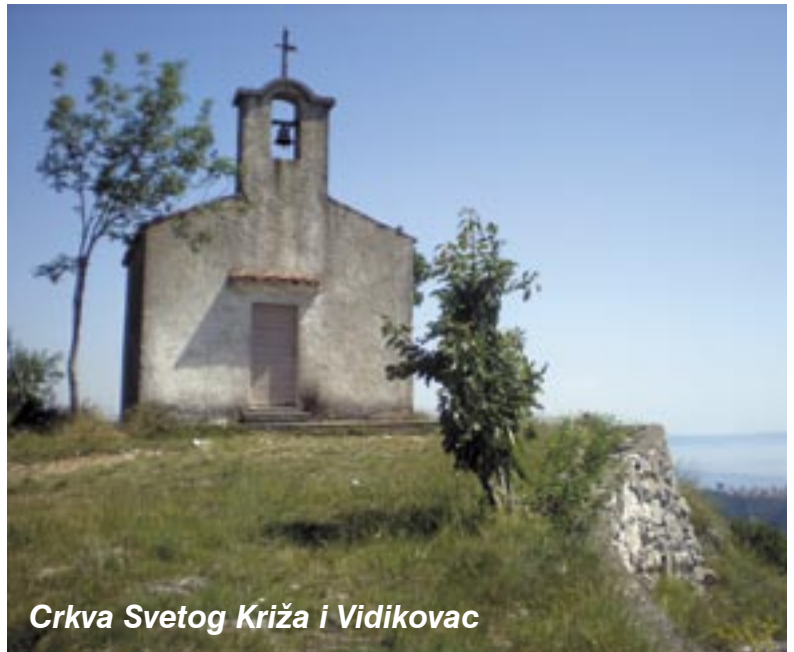
Crkva Svetog Križa i Vidikovac