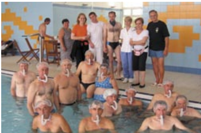
ZADOVOLJSTVO OBOLJELIH - Humanitarnim koncertom do plivanja

Nakon uspješnog humanitarnog koncerta "Glas za glas" koji je krajem studenog održan u Domu kulture u Čavlima, a koji je organizirala klapa Grobnik u sklopu Grobničke jeseni javio nam se Klub laringektomiranih Primorsko-goranske županije.