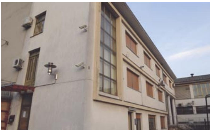
U prostorima Doma odsad odvjetnički ured i građevinska tvrtka

slobodnog prostora bez naknade dodijeljen je Turističkoj zajednici Općine Čavle te resoru zdravstva i socijale, odnosno predškolskog i školskog odgoja, kulture i sporta. Podsjetimo da ostale prostore od ranije koriste Dobrovoljno vatrogasno društvo Čavle, matični ured, pošta i Erste banka.