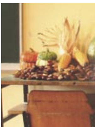
Jesen u 2. a