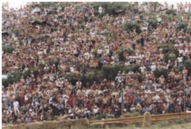
Prve godine Grand Prix-a - mravinjak na Grobniku

Grobnička staza, koja je zadovoljavala stroge svjetske standarde, građena je tijekom proljeća i ljeta. Posljednja Grand Prix utrka Svjetskog prvenstva u motociklizmu te