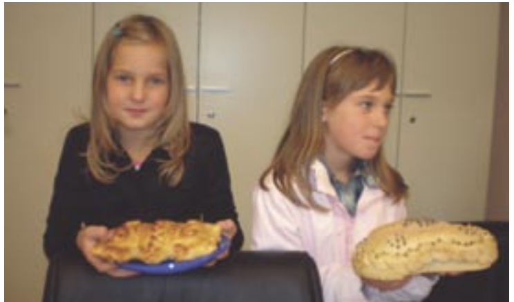
Zahvalnost učenica za plodove zemlje

Ova Zahvalnica, upućena iz Malog Lošinja 5. listopada 2008. godine, nosi pečat i potpis Ministarstva znanosti, obrazovanja i športa Republike Hrvatske, republičke Agencije za odgoj i obrazovanje i Udruge Lijepa Naša iz Zagreba.