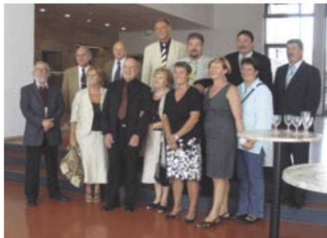
Susret u gradskoj vijećnici u Stuttgartu

Naravno, Međunarodna likovna kolonija Grobnik ne postoji samo radi okupljanja likovnih umjetnika, stvaranja umjetničkih djela za Likovnu galeriju i priređivanja izložbi. Kao čedo Katedre Čakavskog sabora Grobnišćine i Općine Čavle ona ima i ulogu kulturnog i društvenog povezivanja naše Općine s drugim udrugama i zajednicama. Stoga su i prije izložbe u Sindelfingenu s domaćinom dogovoreni brojni kontakti i susreti.