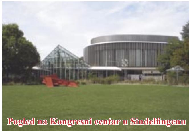
Pogled na Kongresni centar u Sindelfingenu

Međunarodni karakter likovne kolonije, njeno vrhunsko umjetničko vodstvo, te samoprijegoran i djelotvoran rad vodstva Katedre, uz povjerenje i potporu odgovornih ljudi Općine Čavle, stvorili su čvrst temelj za