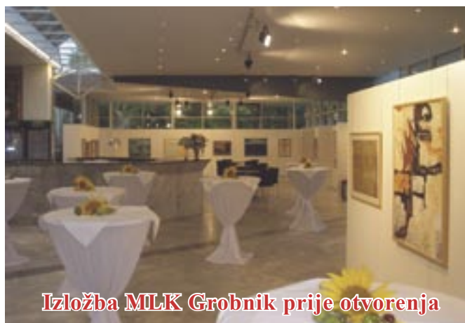
Izložba MLK Grobnik prije otvorenja