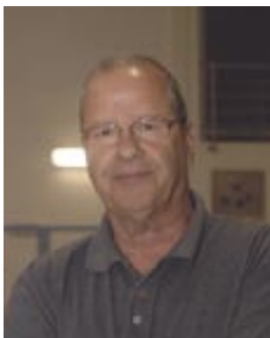
Piše: Milivoj Kraić

Danas Ženska liga broji deset klubova, a to je natjecanje i neslužbeno prvenstvo Hrvatske za žene jer prvakinja stječe pravo sudjelovanja na Europskom prvenstvu