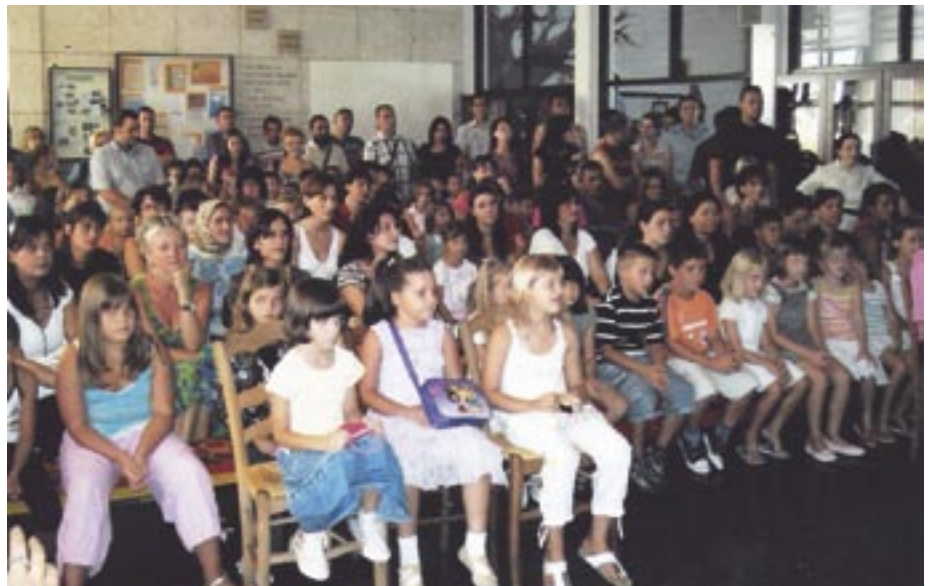
Prvi rujan - veliki dan za male prvašiće (detalj sa svečanosti povodom prvog dana škole)

Općina Čavle i ove je godine osigurala novac za čavjanske prvašiće, koji prvi puta sjedaju u školske klupe Osnovne škole Čavle. Za razliku od prošlogodišnjih 200, ove