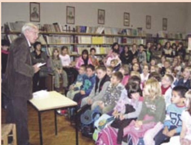
Poznati pisac Mladen Kušec s učenicima OŠ Čavle