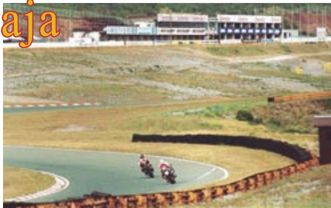
Automotodrom danas ostvaruje zauzetost od 320 dana godišnje

sezone bila je predviđena na Grobniku 17. rujna 1978. godine. Mnogi su mislili da pista neće biti dovršena na vrijeme, ali se srećom to nije dogodilo. Dapače, utrka se održala, a Grobničku ljepoticu pohodili su najbolji svjetski motociklisti pa i oni motociklisti koji su već osigurali naslov svjetskog prvaka te godine.