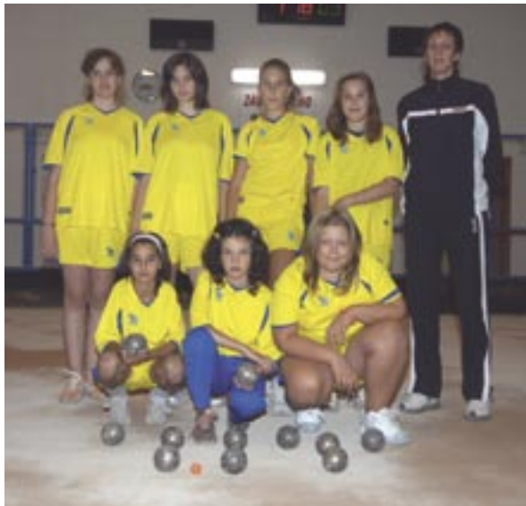
Najmlađa registrirana ženska ekipa u Hrvatskoj izazvala je veliki odjek i pozitivne komentare

Na našu inicijativu, Boćarski savez Primorsko-goranske županije je ove natjecateljske 2008. godine registrirao naše djevojke u jedan klub i uključio ih u natjecanja Ženske lige. Danas Ženska liga broji deset klubova, a to je natjecanje i neslužbeno prvenstvo Hrvatske za žene jer prvakinja stječe pravo sudjelovanja na Europskom prvenstvu. Trebalo je tako brzo nabaviti dresove, sportske torbe i trenerke za djevojke. Dresove i boće posudili smo iz