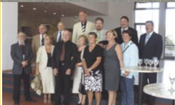
Susret u Stuttgartu

Izložba MLK Grobnik Kulturni most Čavle - Njemačka