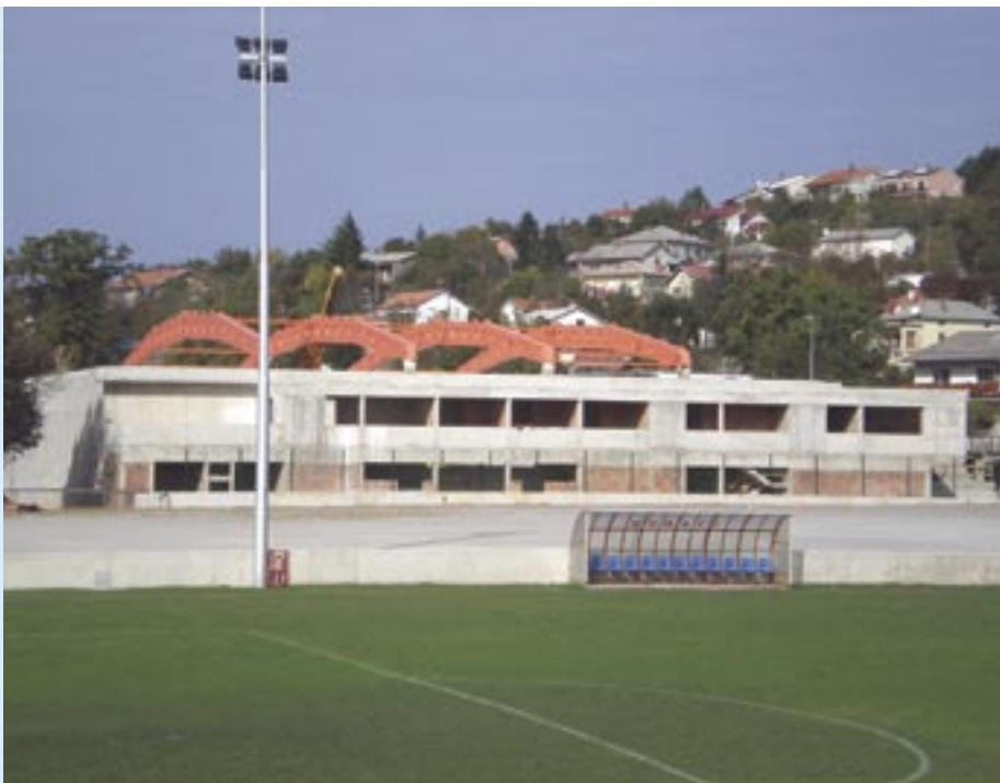
Objekt vrijedan 40,2 milijuna kuna – najvredniji zahvat od ustrojstva Općine Čavle – svakim danom sve bliže dovršetku

Polivalentna dvorana tlocrtno površine od gotovo 3 tisuće četvornih metara pružat će mogućnost igranja odbojke, košarke, malog nogometa, rukometa i drugih sportova, a imat će 650 sjedećih mjesta.