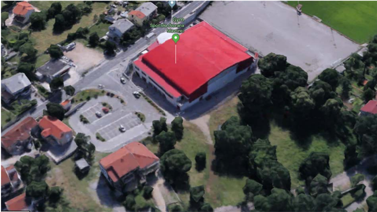
Izgled lokacije 3, fotografija iz zraka

Lokacija 3 – ocjenjuje se da oblik i veličina čestice Plana oznake R1, ne odgovaraju prostoru potrebnom za osiguranje potrebnih parkirnih mjesta za sportsku dvoranu; Također je razvidno da od donošenja Plana na snazi do danas, nije temeljem Plana riješen problem smještaja vozila u mirovanju;