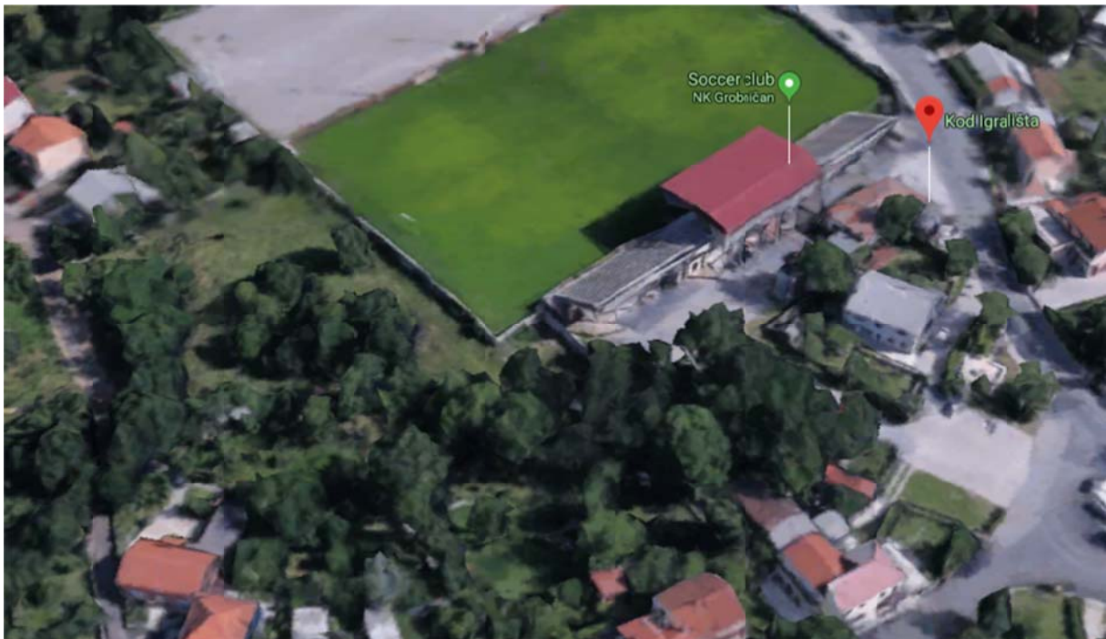
Izgled lokacija 1 i 2, fotografija iz zraka

Lokacija 2 - ocjenjuje se da na građevnoj čestici Plana oznake R2 nije moguće ostvariti rekonstrukciju tribina i osiguranje potrebnog broja parkirnih mjesta bez nove provjere te mogućnosti sukladno planovima Općine;