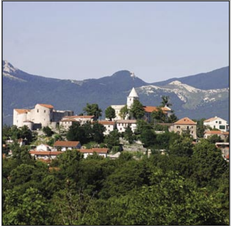
Grad Grobnik: Prema posljednjem popisu 382 stanovnika

osnovnu školu imalo je 24 posto stanovnika, a u čitavoj Županiji 19 posto. U riječkom prstenu veći postotak od Općine Čavle imale su općine Jelenje i Klana.