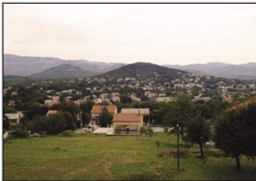
Grmajna, broj 1, kolovoz 2006.