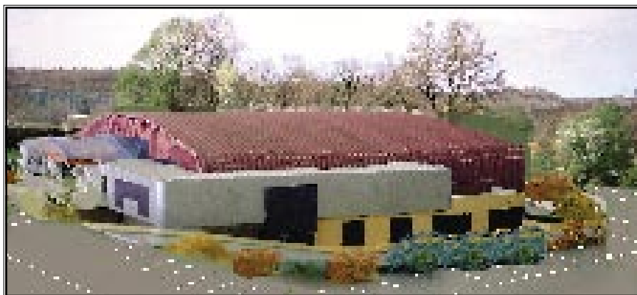
Kompjuterski prikaz buduće sportske dvorane