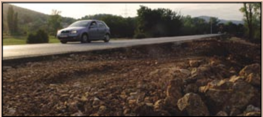
Radovi na još jednoj dionici

Općina Čavle i Županijska uprava za ceste nastavljaju zajednički projekt rekonstrukcije dijela županijske ceste na dionici Čavle-Filon- Jezero. Ove godine uredit će se prometnica od Majera prema Jezeru. Općina Čavle sufinancira postavljanje nogostupa i javne rasvjete te rješavanje oborinske odvodnje, a radove na rekonstrukciji prometnice financira Županijska uprava za ceste. Ukupni troškovi iznositi će 1,1 milijun kuna, od čega će Općina Čavle financirati 493 tisuće kuna.