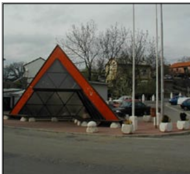
Bivša lokacija čekaonice u Cerniku

Općina Čavle i ove godine nastavlja s uređenjem autobusnih čekaonica. Dosad je dovršena montaža dviju čekaonica u Cerniku, a za blagdan Bartoje promijeniti će se i postojeća čekaonica uz crkvu. Naime, mještani ni nakon 8 godina nisu prihvatili izgled neobične čekaonice, koju su neki nazivali i svemirskom, pa je donesena odluka da se ona zamijeni. Stara čekaonica će se pokloniti crkvi u Cerniku i postati kapelica sv. Bartola, a na njezino mjesto postaviti će se nova tipizirana autobusna čekaonica. Dodajemo ovome da će se do kraja godine zamijeniti i devastirana betonska čekaonica na Vrhu Čavala.