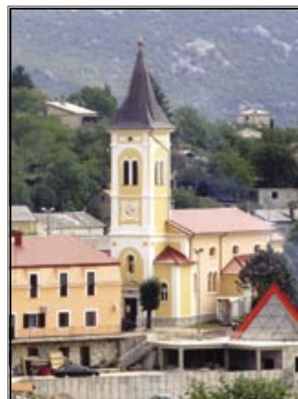
Crkva Sv. Bartola u Cerniku

- 20.30 – Pučka veselica u dvorištu crkve sv. Bartola uz tamburaški orkestar «Češeri» iz Mrkoplja i orkestar braće Mamuza.